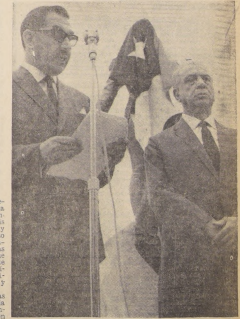
En la Avenida República de Chile, en Rio de Janeiro, fue inaugurado un monumento al prócer, General don Bernardo O'Higgins. El Ministro de Defensa Nacional de Chile, Juan de Dios Carmona, se ve en el grabado la mañana de la ceremonia de la inauguración. Junto al Ministro chileno, el Gobernador de Rio de Janeiro, Francisco Negro de Lima.

MONTEVIDEO, 19 (UPI) — Los delegados presidenciales que preparan la "Conferencia en la Cumbre" del hemisferio occidental, completada ya la mitad de su temario, concentraron hoy sus deliberaciones sobre los temas de comercio exterior e integración económica. La reunión, que tiene por fin analizar en detalle los puntos que serán sometidos a consideración de los Presidentes americanos en su conferencia del 12 al 14 de abril próximo, en el vecino balneario de Punta del Este, ha concluido la primera de sus dos semanas de trabajo desdichando tres de los seis puntos incluidos en su programa. Tras la sesión celebrada anoche se informó que quedaron terminados los temas de Educación, Ciencia y Tecnología e Infraestructura. De acuerdo con el programa pre-