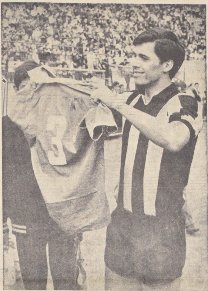
Elías Figueroa, muestra orgulloso y visiblemente emocionado, la casaca de Wanderers que le sirvió de trampolín a la fama. Un homenaje multitudinario y generoso, le tributó ayer al ahora zaguero de Peñarol, la afición de Valparaíso y Viña, que llenó el Estadio Sausalito.

Fiesta en Sausalito. — Estadio rebordado de un público que venía a aplaudir, fundamentalmente a su ídolo Elías Figueroa, que formaba ahora en las filas de Peñarol, rival de acurria para la octava de Wanderers, el ex club del crack internacional. La fiesta comenzó al entrar los equipos a la cancha en una formación muy especial. Adelante, Figueroa encabezado una especie de pelotón desfile, con su casaca de Wanderers con el N.º 3, que usara hasta hace algunas semanas; más atrás, entrenados jugadores de Peñarol y Wanderers portando banderas chilenas y uruguayas. Toda ellos encabezados por el comandante del Cuerpo de Carabineros. Luego los discursos, las flores para la esposa de Figueroa, la vuelta al estadio en medio de una célebre ovación y todo ese espectáculo emotivo y colorido que los chilenos sabemos organizar tan bien y que tanto