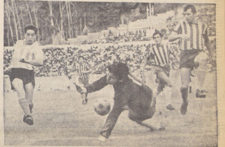
Contreras, el poco estilizado arquero de Everton detiene con mucho esfuerzo una pelota tocada por Hector Vidal, delantero de Magallanes. Más ordenado y cerca de estructurar un buen conjunto se vio Magallanes al ganar a los viamarinos en Sausalito. Los dueños de casa en cambio fueron todo desorden y pobreza de recursos. Malo el panorama para los "ruleteros" si no mejoran.