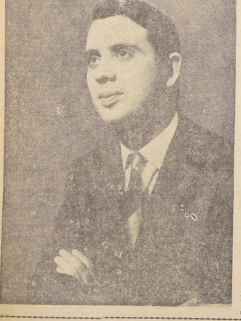
Juan Ramón, cantante argentino, en un momento de su actuación.

Juan Ramón nació en 1940 en la ciudad de Campana, a orillas del Río Paraná y a unos 60 kilómetros de la capital argentina, Buenos Aires. Durante sus estudios aprovechaba los ratos libres para cantar y comenzó también la preparación de programas de radio para las estaciones de Buenos Aires, llegando a tener simultáneamente varios espacios en distintas emisoras. No tardó en llegarle la oportunidad buscada y uno de los sellos independientes de la Argentina lo contrató, comenzando a difundirse sus discos con buena aceptación por parte del público, en 1962. Bautizado con el sobrenombre "Corazón" Juan Ramón fue ubicándose poco a poco