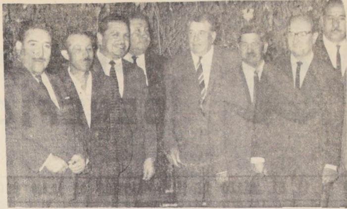
Comerciantes de los diferentes mercados de la capital y grupo numeroso de chacareros de las diferentes comunas del Grana Santiago ofrecieron...