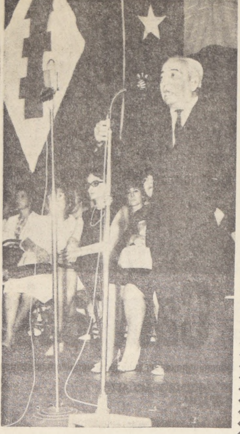
El senador Rafael Agustín Gumucio interviene en la concentración del Teatro Baquedano, donde fueron proclamadas las 38 candidatas a regidoras del PDC por Santiago.