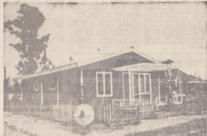
Esta hermosa y cómoda casa prefabricada puede ser suya. Con un boleto numerado del Concurso "Estrellas del Deporte, el Teatro y la Canción" soluciona el sueño del hogar propio en la ciudad, en la montaña o en la playa. Compañía Agrícola y Forestal "COPIHUE" S. A. y las "Estrellas" se la ofrecen desde ya. Junte a sus astros preferidos y esta confortable casa será de su propiedad.

¿Tiene usted un sitio erizado en donde sueña con levantar algún día una casa para vivir, pasar sus fines de semana o simplemente donde disfrutar las vacaciones, pero carece de los medios económicos suficientes para dar cima a ese sentido anhelo suyo? El millonario certamen de LA NACION, "Estrellas del Deporte, el Teatro y la Canción" le brinda la oportunidad precisa para solucionar ese problema del inmueble soñado. Adquiera un Album de las "Estrellas", junto a sus astros favoritos y por cada SEIS (6) PAGINAS COMPLETAS, recibirá un BOLETO NUMERADO, con el cual podrá participar en los sorteos previstos y en la gran final de diciembre próximo. En uno de esos boletos numerados está la casa prefabricada compuesta de dos dormitorios, living-comedor, cocina y baño, que la Compañía Agrícola y Forestal "COPIHUE" S. A. obsequia como auspiciador del certamen a los concursantes de todo el país.