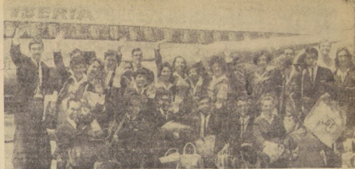
Vi Iberia se dirigieron a Europa, un grupo de estudiantes de la Universidad de Chile de Valparaíso, quienes van en plan de difusión de nuestro folklore por capitales del viejo continente: Madrid, Roma, Praga y Moscú...