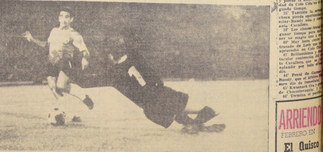
Beiruth pierde frente al arquero Wenzel, de la Selección de Checoslovaquia, una de las pocas oportunidades que tuvo Colo Colo en su derrota de anoche.