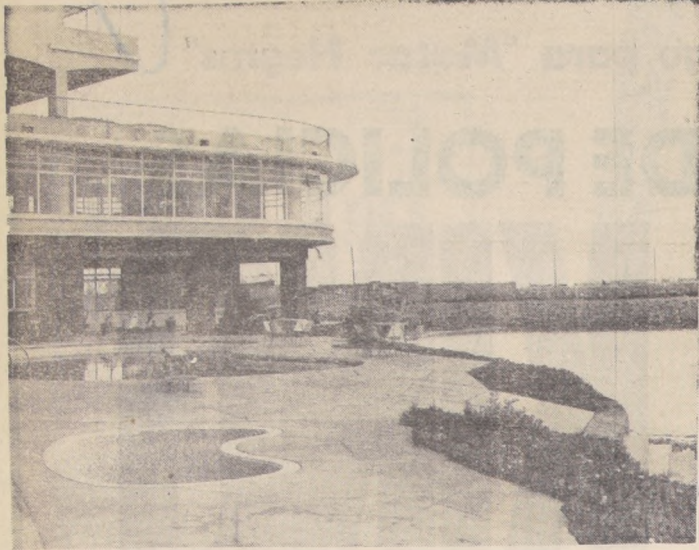
Chile, poco a poco está levantando una bien distribuida red hotelera a lo largo del mar. Hoy estos muestran su confortable estructura desde las hosterías de Arica hasta Tierra del Fuego, donde se levantan las cabañas de "Patagonia Inn". En el grabado, un aspecto del jardín junto a la playa del Hotel Turismo de Antofagasta.