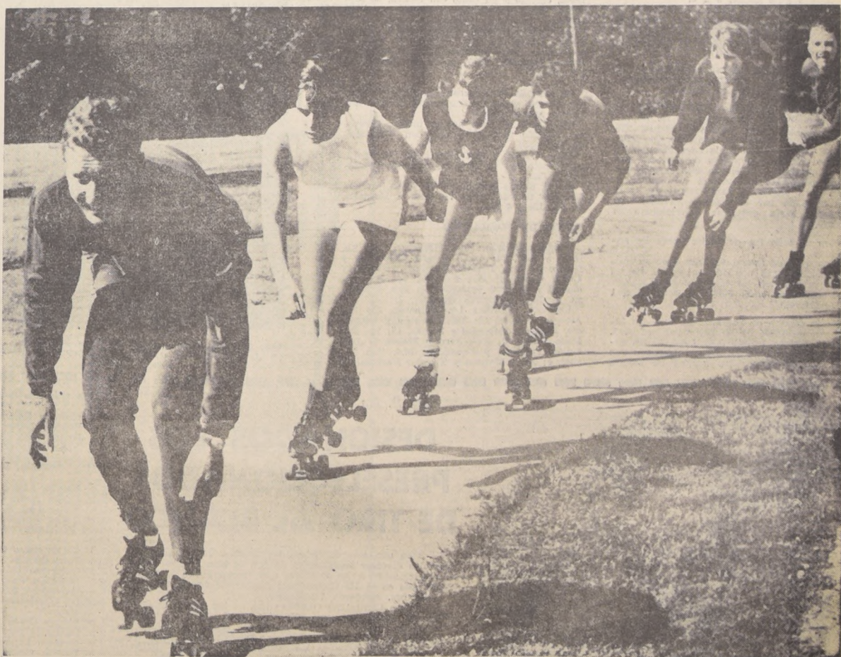
Muchos muchachos y muchas muchachas de Alemania, se dedicaron al patinaje, pensando emular las hazañas de Gunter Traub, quien es varias veces campeón alemán y campeón mundial.

Un Triángulo: Riera - U. C. y la Central