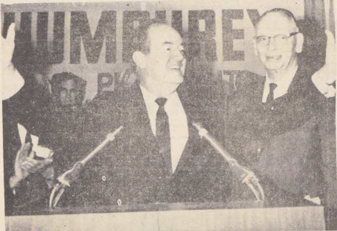
Hubert H. Humphrey, actual Vicepresidente de los Estados Unidos, capitalizó, según encuestas del "New York Times", los votos demócratas que que- daron en libertad de acción tras el asesinato del otro can- didato a la Presidencia, el se- ñador Robert F. Kennedy. Se pronostica como posible una fórmula presidencial integrada por Humphrey para Presidente y Edward Kennedy, hermano menor de los difuntos John y Robert, para Vicepresidente.