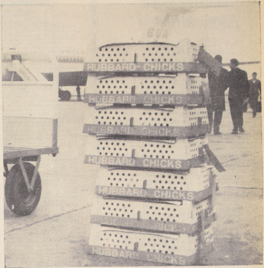
OCHOCIENTOS MIL POLLOS de un día empezaron a llegar ayer a Santiago, los que están destinados para el consumo de septiembre venidero. Las aves fueron adquiridas a través del Ministerio de Economía en EE. UU. Las cajas del grabado corresponden a una partida de diez mil unidades, la que tuvo una pérdida que no llegó al dos por ciento, cifra reducida si se considera que los pollos no tienen más de un par de días y que durante el viaje se deshidrataron. Dura fue la tarea de los que se encargaron de bajarlos del avión. En esta oportunidad se les da agua mezclada con elementos medicinales. En el grabado, las cajas con el volátil cargamento. — (FOTO PUDAHUEL.)