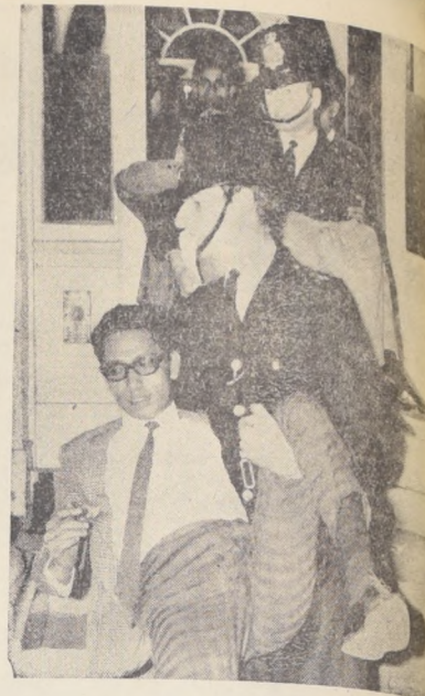
La policía inglesa demuestra una vez más tener sus propios métodos para actuar. Un grupo de estudiantes pakistaníes ocuparon la residencia del Alto Comisionario en Londres...

El diario cita explícitamente las diferencias entre revolucionarios independientes y afiliados a los partidos comunistas pro-soviéticos en América Latina.