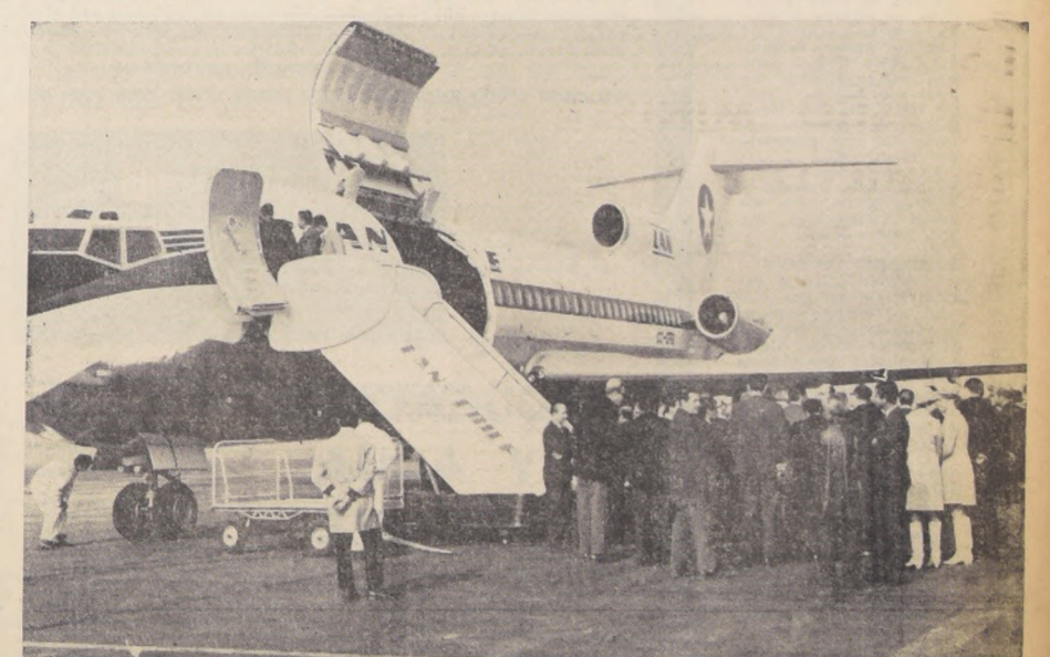
LLEGO EL TERCER BOEING PARA LAN. En la mañana de ayer llegó al aeropuerto de Los Cerrillos el tercer avión Boeing 727-100, de los cuatro que LAN-CHILE adquirió en los Estados Unidos...