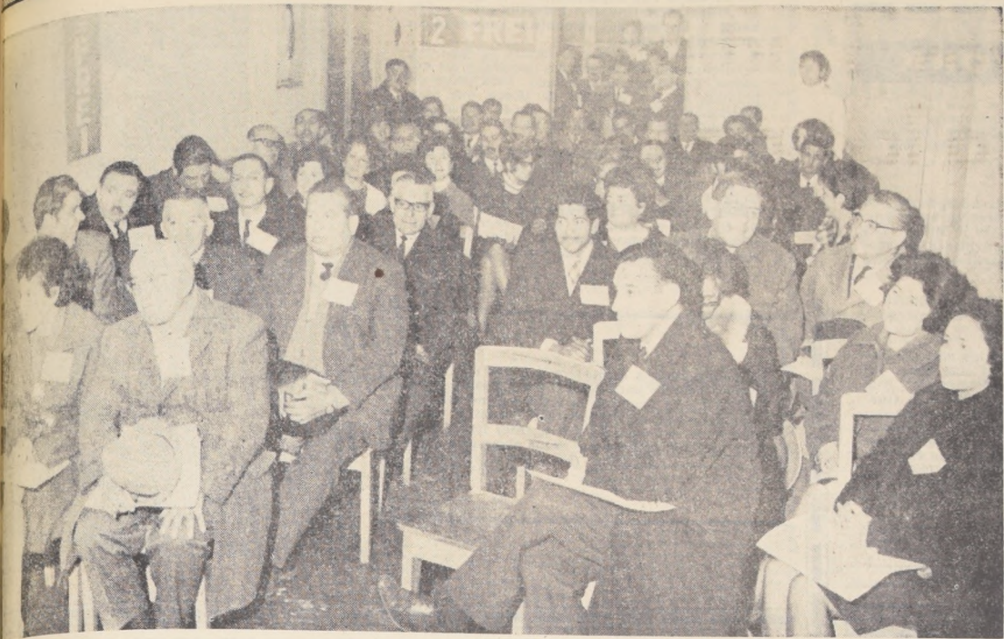
Señalando muestra parte de los asistentes al primer Congreso de Grupos Comunitarios, organizado por el Consejo Comunal Nuñoa del Partido Demócrata Cristiano, y que finalizó el domingo último. El acto inaugural contó con la asistencia del Ministro de Obras Públicas, Sergio Ossa...