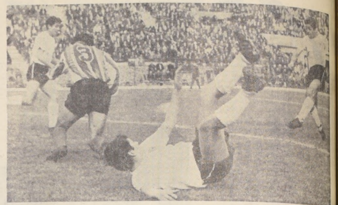
nida Colloa firmes en los primeros puestos del Provincial.