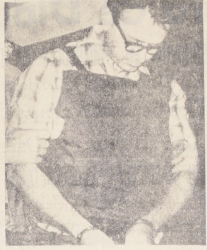
En esta notable fotografía, Earl Ray, el acusado de ser asesino de Luther King, aparece cuando fue conducido ante el tribunal para la audiencia preliminar de su juicio, en la cual se declaró inocente. El delantal que parece llevar no es tal, sino un chaleco a prueba de balas, para que nadie pudiera repetir con él lo sucedido a Oswald.

metros al noroeste de Danang, según anunciaron oficialmente las autoridades militares estadounidenses. Worley pilotaba un avión a reacción de reconocimiento fotográfico. Las autoridades agregaron que su copiloto logró saltar sano y salvo en paracaídas. Worley había sido designado Vicecomandante de la Séptima Fuerza Aérea en julio de 1967 y el 1.º de septiembre próximo debía asumir la jefatura de operaciones de la Fuerza Aérea del Pacífico. Worley, quien tenía 48 años de edad, residía habitualmente en Palm Desert, una población de su Estado natal de California. Comenzó su carrera como cadete en 1940 y recibió el título de piloto en Texas un año más tarde. Durante la Segunda Guerra Mundial, Worley actuó en el norte de Italia, Sicilia y en Italia continental, sirviendo también en el Pacífico. Su record incluye 120 misiones aéreas y 215 horas de combate.