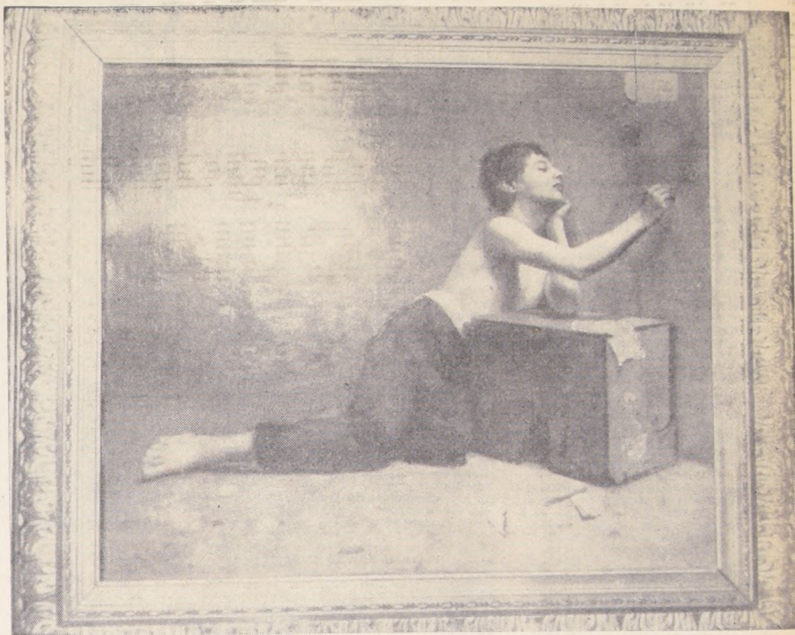
La muestra titulada "Maestros de la Pintura Chilena" inaugurará el próximo viernes, en el Palacio de la Alhambra, la Sociedad Nacional de Bellas Artes. Los cuadros que en ella podrá admirar el público pertenecen en su mayoría a coleccionistas privados, que los han guardado como valiosos tesoros. En el grabado, una obra del maestro Baca Flor, artista del siglo pasado, que ha sido avaluada por su propietario en $ 100 millones