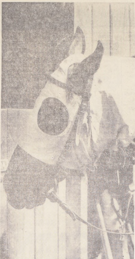
BIEN FALLADA, encontrará pista propicia este domingo, en la prueba central del Club Hipico.

(1316) NOVENA CARRERA - 1.400 metros. - 4a. Serie. - A las 16.05 horas. - (2º al 3º) - Segunda Valida para la Triple Final con Dividendo al 1º y 2º.