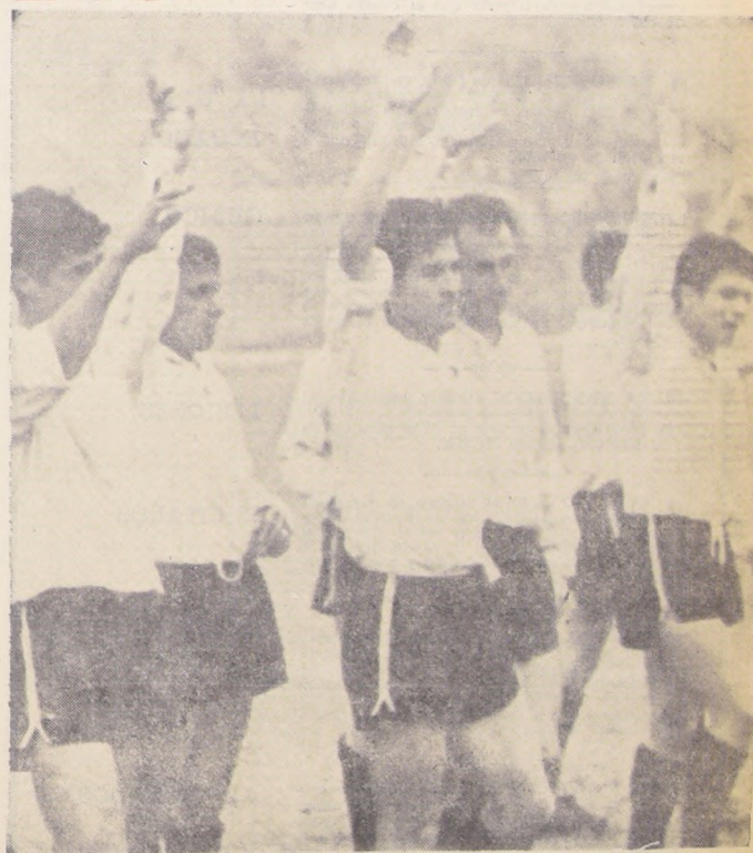
El rostro abatido frente a la derrota, pero siempre la mano en alto, despidiéndose. Pese a la pobre campaña del equipo los dirigentes afirman que en la tienda no existen ni han existido problemas de orden económico.