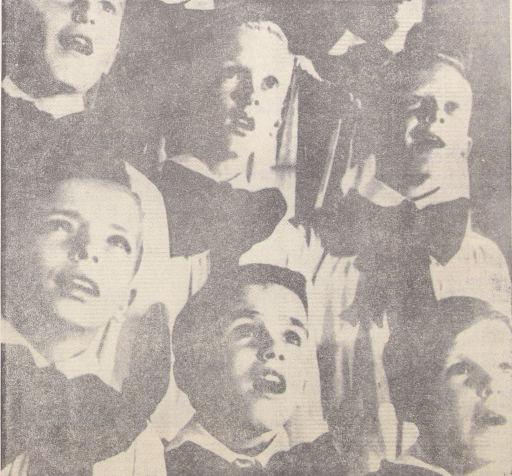
Veintiséis voces componen el Coro de los Niños Cantores de USA, único conjunto en el mundo que incluye óperas en su repertorio. Llegará a Chile el 1.º de agosto y hará solamente dos presentaciones en Santiago. El conjunto, que ha ofrecido conciertos en el Carnegie Hall y actuado junto a la Filarmónica de Nueva York, bajo la dirección de Leonard Bernstein, estrenará en Chile la obra "La Vanidad Dorada"