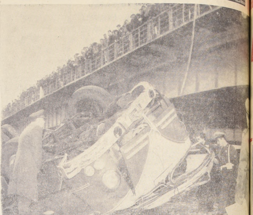
En medio de la mirada de centenares de curiosos, situados en la baranda oriente del puente sobre el río Cachapoal, el grupo investigador del SIAT cumple su cometido técnico-judicial. La forma en que quedó la quina sobre el lecho pedregoso del río, permite apreciar la magnitud de la tragedia.

El capitán del patrullero peruano al proceder a la captura del pesquero manifestó que éste "estaba operando en aguas de su país sin autorización, por lo cual tomó las providencias establecidas por las leyes internacionales".