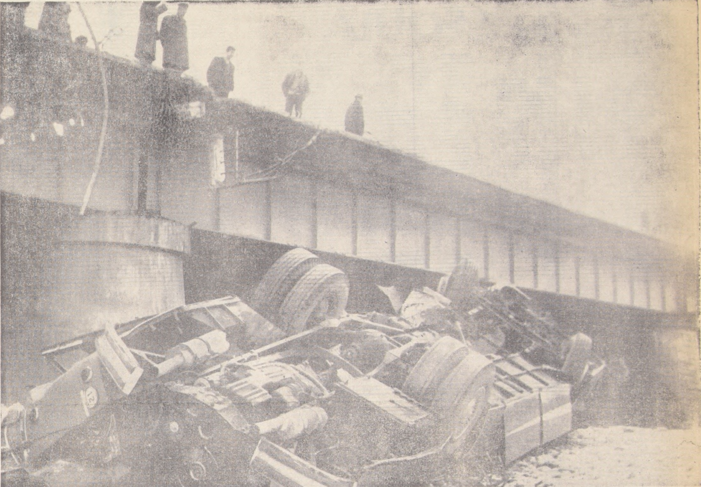
En esta forma quedó el bus que ayer se precipitó al lecho del río Cachapoal. Cuatro muertos y 31 heridos fue el saldo del trágico accidente, producido, según declaraciones de testigos, por el exceso de velocidad con que la máquina entró al puente sobre el río. Dramáticas escenas se produjeron entre las víctimas, cuyo número no fue mayor, debido a la prontitud con que fueron auxiliadas

"Hubo Confabulación Previa en la Fuga de A. Argüedas"