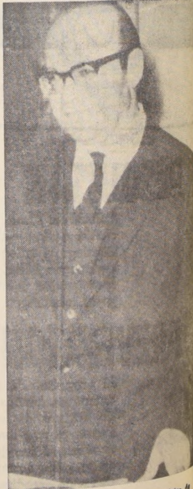
Jaime Castillo Velasco: nuevo Ministro de Justicia

Posteriormente se reunirá con los jefes de servicio dependiente de ese Ministerio con el objeto de imponerse de la marcha de los trabajos en cada uno de ellos.