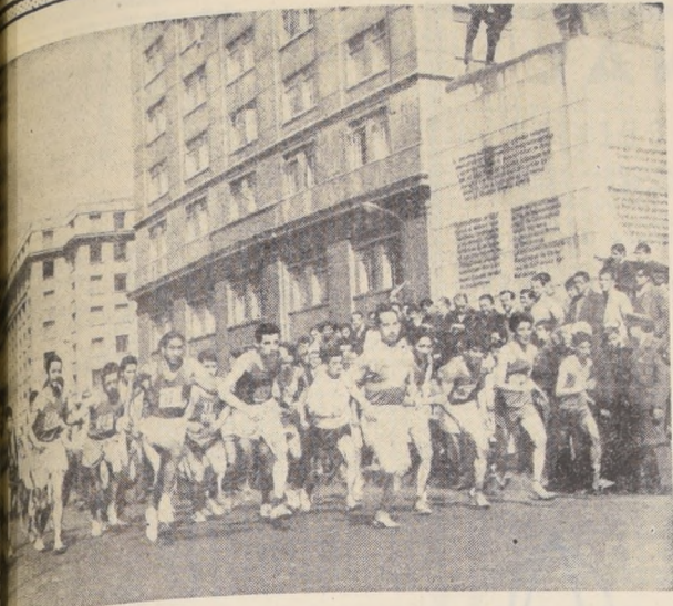
Al monumento al General Bulnes partió cerca de un centenar de atletas de diversos clubes de la capital. Muchísimo público alento a los fondistas que dieron vida a la prueba "Carabineros de Chile".