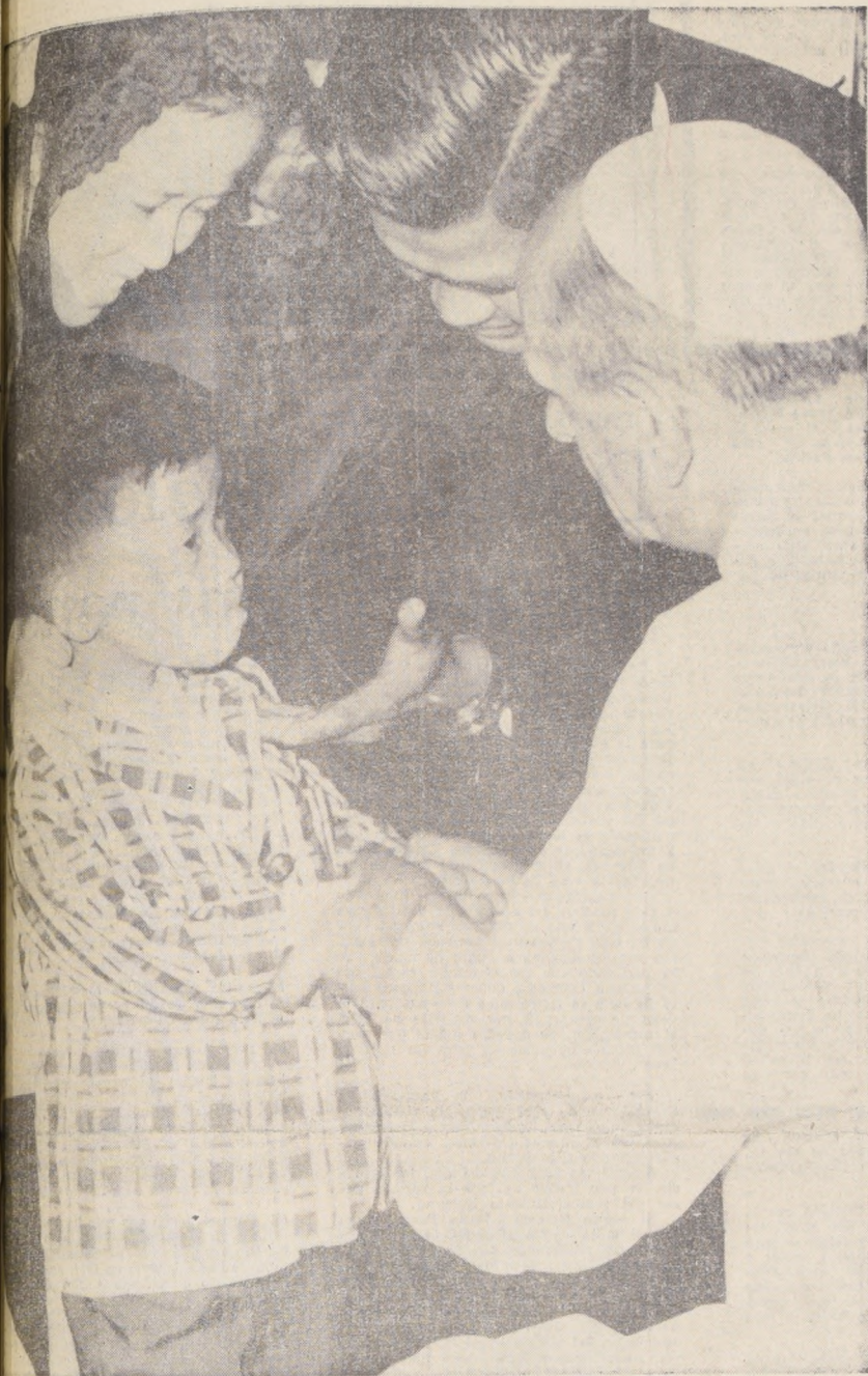
UNA ESPECIAL PREDILECCION por los niños tiene el Papa Paulo VI, que se prepara para realizar su primera visita a Sudamérica. En el grabado, el Sumo Pontífice, durante una audiencia general celebrada en su Palacio de Castelgandolfo, acaricia a dos pequeños sudvietnameses.

ASISTENCIA A DOS MIL OCHOCIENTOS TRABAJADORES DEL CAMPO