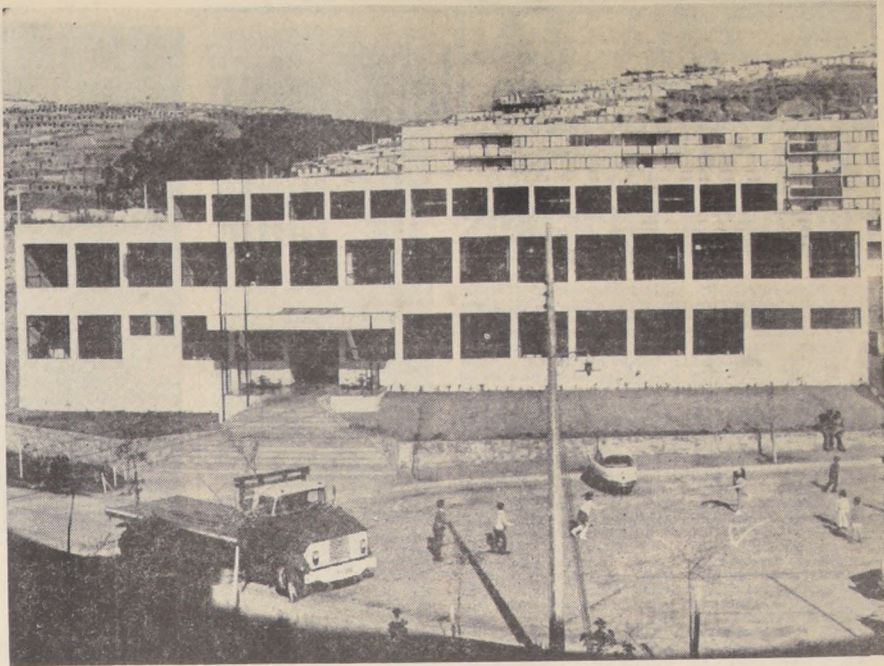
MODERNA ESCUELA EN VALPARAISO.— Mañana, con asistencia del Ministro de Educación, Máximo Pacheco, y representantes de la Sociedad Constructora de Establecimientos Educativos y del Director de la Misión Económica de los Estados Unidos, Sidney Weitraub, será inaugurada en la Población "Lord Cochrane", del vecino puerto de Valparaíso, una escuela con capacidad para 630 alumnos. Acto que coincidirá con la celebración del séptimo aniversario de la Alianza para el Progreso, dentro de cuyo programa cristalizó la edificación de este plantel primario porteño. La Escuela, levantada por la Sociedad Constructora de Establecimientos Educativos, ocupa una superficie de 1.780 metros cuadrados, en la que se distribuyen diez salas de clases, dos talleres, biblioteca, sala de actos y dependencias para las oficinas administrativas. El plantel está emplazado en un sector porteño que cuenta con una densa población escolar.