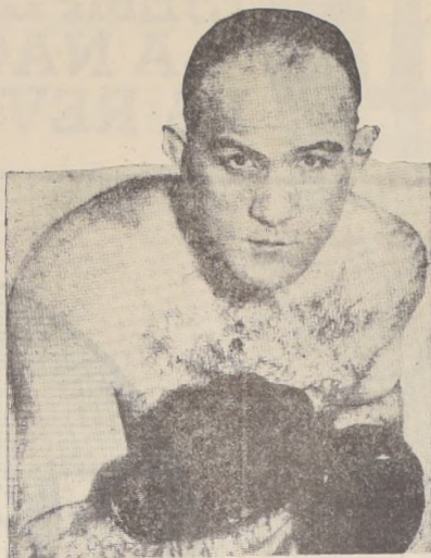
MARCEL THIL. — No pudo vencer en su último combate frente a la muerte.