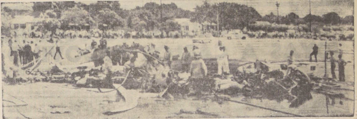
● ESTA PATETICA FOTOGRAFIA muestra los restos del helicóptero en que perecieron dieciocho pasajeros y tres tripulantes. El aparato se dirigía desde la ciudad de Compton, en California, a la llamada "Ciudad de la Fantasía", o Disneyland, famosa en todo el mundo y que procuran visitar los turistas.