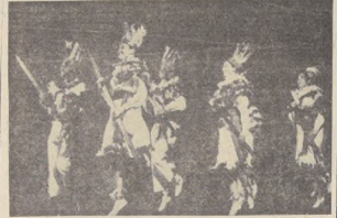
Integrantes del Ballet Folklórico "Aucamán", en escena de "La Tirana".

1967 vio la gran emergencia de los blues en la reciente historia de la música popular. Fue el año en que los ritmos y el blues llegaron a ser la música en cartería y los blues, la música de América, en la vanguardia de este nuevo estilo, estaba la renombrada cantante de color ARETHA FRANKLIN. Aretha canta los blues pero son unos blues con di. Aretha. Porque estos temas de hoy son muy diferentes a los del año 30 o por lo menos a los del año 40, por lo que ARETHA FRANKLIN más que ninguna oíen las dadas ritmos modernos y expresiones más sofisticadas. El contenido de este nuevo estilo es un mensaje del alma. A través de la clave del arte de Aretha Franklin está en su música para combinar varios tipos diferentes de música, uniendo expresiones de sus propios sentimientos. Escuchando su propio material, ella no se restringe a los tradicionales blues de los artistas aceptados. No Aretha "se desahoga", como dice el dicho. Si ella cree que una canción es buena, la utiliza, aunque no tenga blues en forma popular. Contrario a lo que se cree, Aretha Franklin siempre cantó en el formato "rhythm and blues" en sus actuaciones personales. Es de sus primeras voces en la iglesia donde se adaptó a cantar un blues y hacerla de una manera muy vibrante. Pero a diferencia de algunos cantantes de evangelio, ella