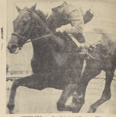
SIMULADO: ...Seguía en corto y en Viña del Mar.