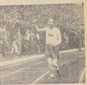
Ahi va Manuel Plaza, ya veterano, recibiendo el homenaje caudoso del publico. Plaza fue uno de los pioneros del atletismo nacional...