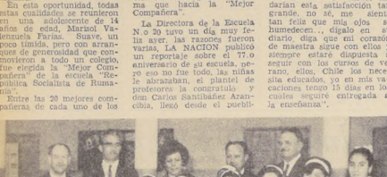
Entre las 20 mejores compañeras de cada uno de los cursos del establecimiento...