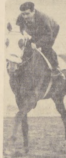
ALUVIÓN: ... La última gran revelación.