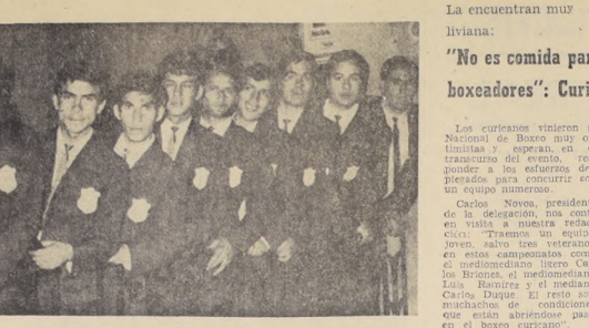
La encuentran muy liviana: "No es comida para boxeadores": Curico

CURICO entró con el pie derecho al Nacional de Boxeo. El miércoles ganaron sus dos debutantes, y están dispuestos a dar guerra firme a los otros equipos de mayor experiencia.