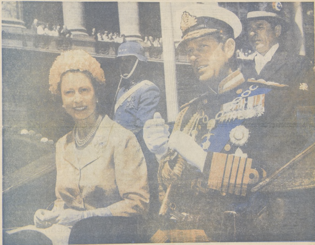
EN EL CORAZON DE CADA CHILENO se han dado cita los tiernos cuentos de antaño con la presencia real de una reina y su esbelto príncipe. La ciudadanía ha vivido así una mezcla de ensueño y realidad. Isabel II y Felipe de Edimburgo han sabido corresponder con enorme simpatía al cariño con que el pueblo los ha rodeado en todo momento, desde que pisaron tierra chilena.

Año LII — No. 13 de Julio — Miércoles 13 de Noviembre de 1968 — Precio: $1.000 — No. 18.508