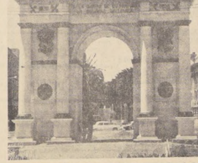
Frente al Arco Británico de Valparaíso se realizará el primer acto oficial de la Reina Isabel II en este puerto...