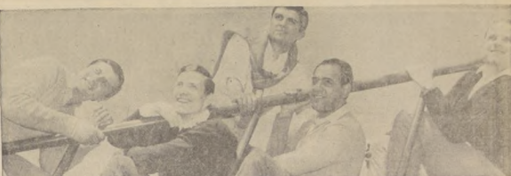
Ahora se anuncia la "probable" llegada de Los Cinco del Ritmo, junto con la reciente aparición de un Long Play. Otro volador de luces para promover un disco?