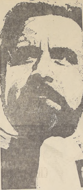
Roberto Carlos, cantante de música tropical, en un momento de su actuación.