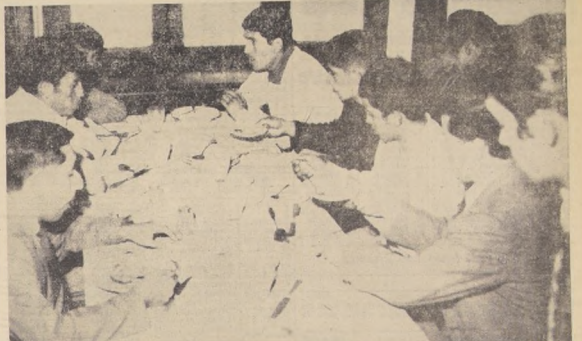
LOS VALDIVIANOS a la hora del almuerzo. Les ha ido bastante bien y hasta el momento no han perdido ninguna pelea...