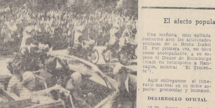
La Reina Isabel II, con y sin Protocolo

Uno de los logros de vuestra historia visita a Chile sea el fortalecimiento de las relaciones culturales, científicas y académicas con Inglaterra.