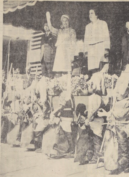
En la Escuela Inglesa, Su Majestad responde al saludo de los alumnos. La acompaña la Primera Dama y el director del plantel.