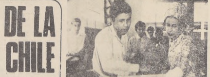
En el Centro Anglo-Chileno del Instituto Nacional de Capacitación Profesional, al cual contribuyó Gran Bretaña, la Soberana se informa del trabajo que cumple un futuro técnico.