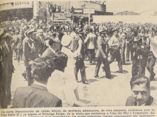
Una bella demostración de cálido afecto, de profunda admiración, de viva simpatía, recibieron ayer la Reina Isabella II y su esposo el Príncipe Felipe...