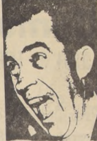
NUOVA YORK, 14 (UPI)

Uno de los artefactos explosivos dinamita y algunos murbes del Comando británico; otro atelido en forma parecida el Casino Militar, sin que estos, como en los restantes atentados, haya víctimas que lamentar.