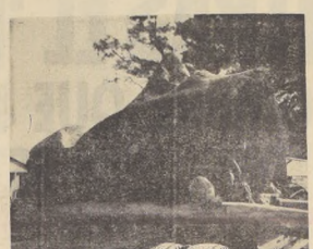
Cabeza del molo "Hoto-Iti" después de ser arrollado por el maremoto que afectó a la Isla en 1960. Este tipo de fenómenos está incluido en las investigaciones realizadas en Pascua por los geólogos de la U. de Chile.