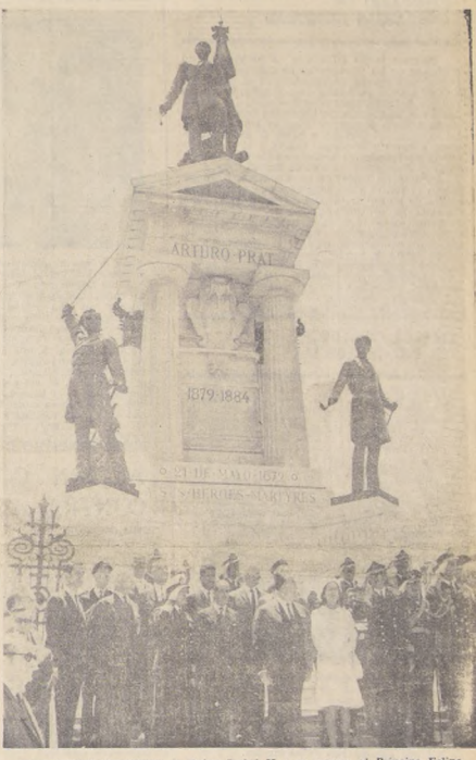
En automóvil descubierta, la Reina Isabel II y su esposo, el Príncipe Felipe, dieron una vuelta a la Plaza Sotomayor antes de dirigirse a Viña del Mar, una vez terminada la imponente ceremonia en el Monumento a los Héroes. Los reales visitantes recibieron una ovación impresionante de parte de centenares de miles de hombres, mujeres y niños, ubicados en la Plaza. La Reina descendió a la cripta de los Héroes, con lo que terminó el acto. En el grabado, durante la ceremonia cívico-militar.

Año LII - Santiago de Chile, Viernes 15 de Noviembre de 1968 - Precio: $ 0,50 - N.º 18.619