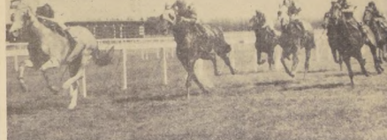
DAMASO consiguió el primer triunfo de su campaña al superar por 1 cuerpo a Supercal en la distancia de 1.000 metros. El hijo de Pizarro II consiguió esta ganancia de punta a punta.