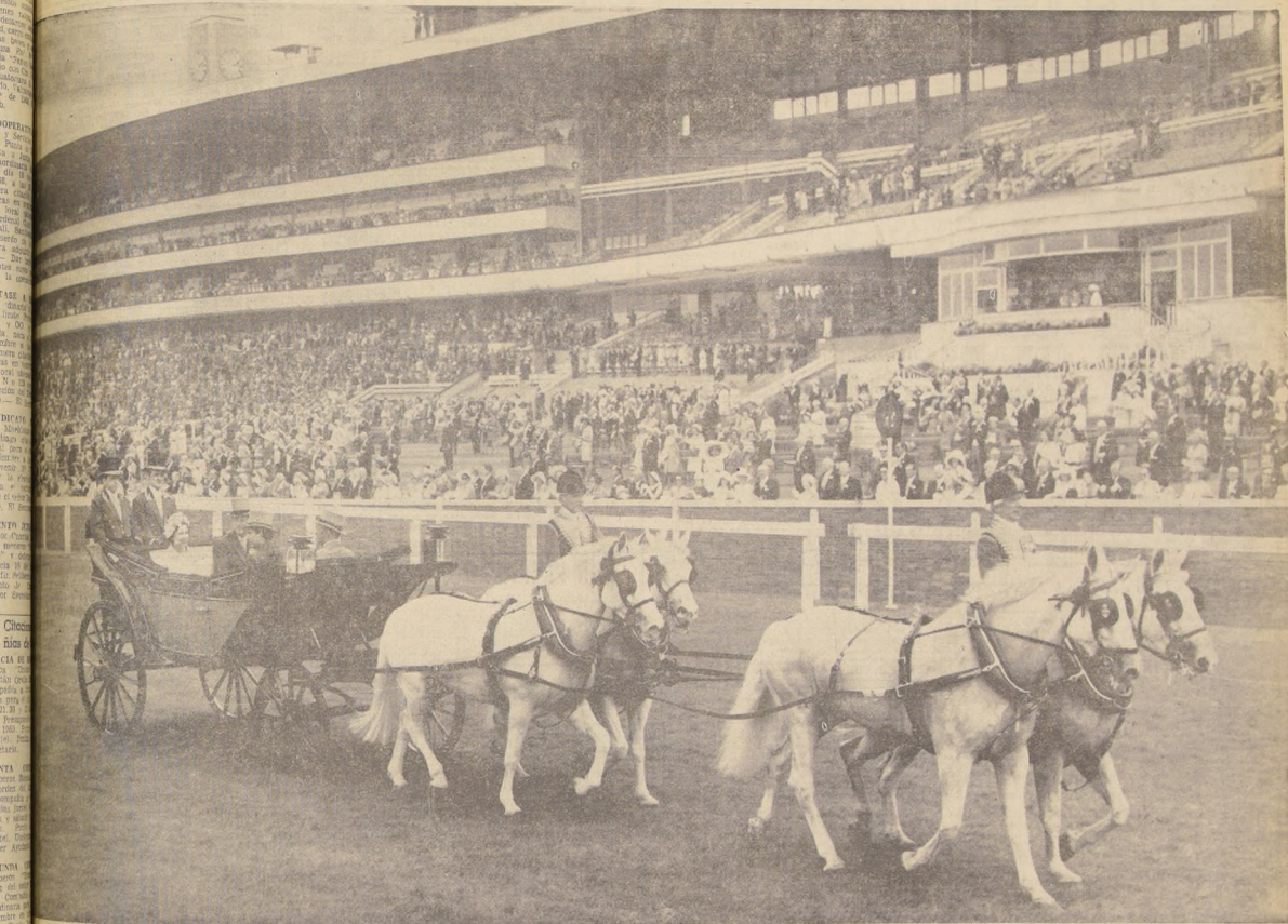
La Reina, acompañada por el Príncipe Felipe, el Príncipe Carlos y el Duque de Beaufort, en coche abierto en el hipódromo con motivo del Real Ascot de 1968. Este premio es una de las ocasiones sociales anuales de la Familia Real.

LA REINA A LAS ARRERAS DEL PRINCIPE POLO