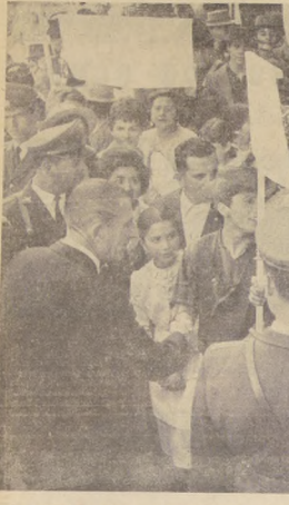
Un animado esquizmo al Presidente Frei ofrecieron el miércoles en el Patio de los Narajales, los conjuntos folklóricos que participan en el Primer Festival Nacional de Folklore que comenzó el miércoles en Talagante. Participan 42 conjuntos que reúnen 805 integrantes de 12 provincias, desde Coquimbo a Chile.