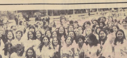
UN GRUPO JUVENIL PARA CANTAR Y REALIZARSE