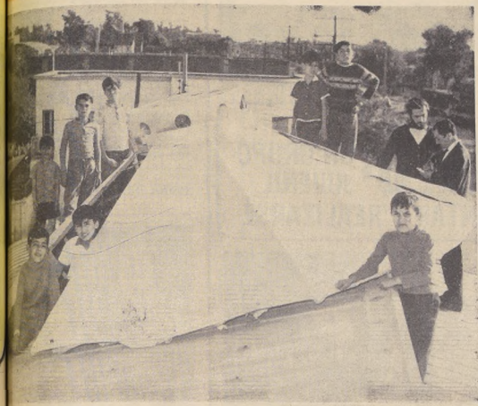
...EL DISCO VOLADOR que "aterrizó" anoche en el techo de la Parroquia Santa Clara, en el Paradero de la Gran Avenida, que celebró sus 20 años de existencia en medio del jubilo de sus feligreses.