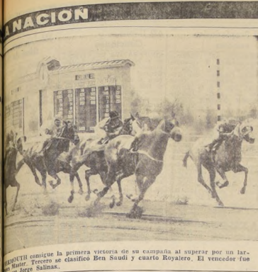
El vencedor de la carrera de la mañana...