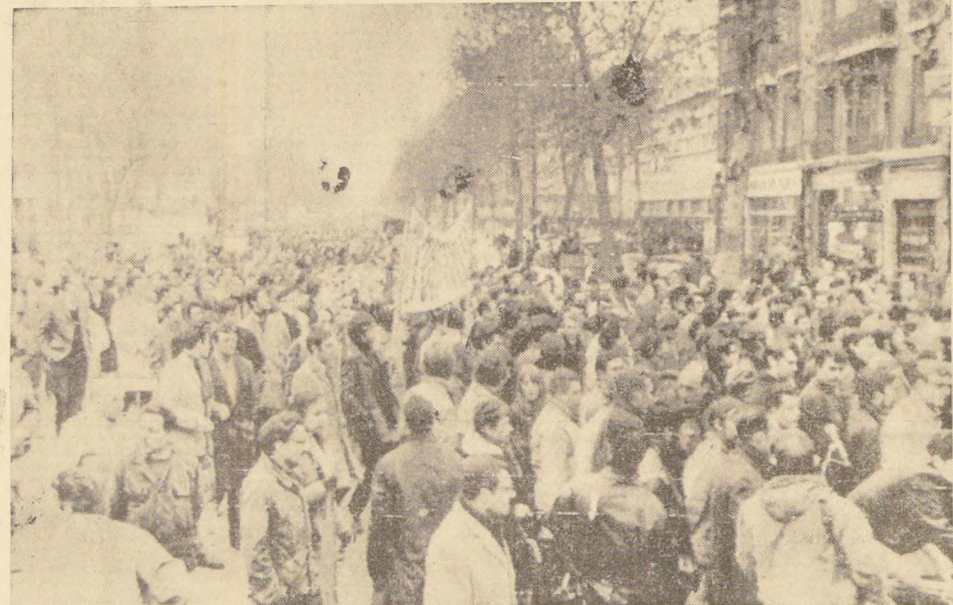
PARIS, FRANCIA.— Miles de trabajadores en huelga, pertenecientes a la gran fábrica de automóviles Renault, realizaron manifestaciones el jueves 5, marchando por las calles protestando por las medidas de austeridad del Gobierno. Esta huelga es la primera desde la general de mayo y junio últimos. (RADIOFO TO UPI.)

Entretanto, el Primer Ministro designado, Mariano Rumor, continuó hoy las negociaciones con los demócrata cristianos, socialistas y republicanos para integrar una coalición gubernamental de Centro-Izquierda y poner fin a la crisis en que se halla sumida la nación desde hace dos semanas.