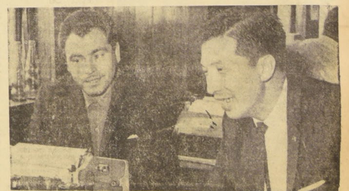
Los pimponistas chilenos, campeones sudamericanos, viajarán, a las 14.30 horas de hoy, vía LAN-Chile, a Buenos Aires, para competir en el Torneo Sudamericano.