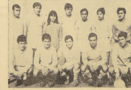
En la fotografía (derecha), los integrantes del Club Deportivo con su candidata, posan para la lente de un activo dirigente