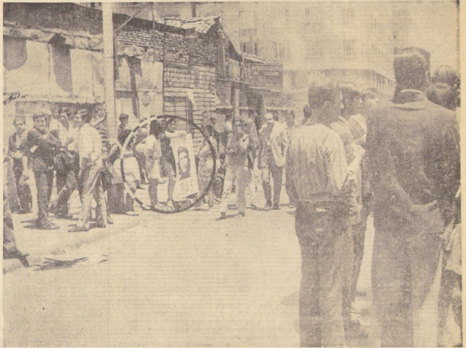
Un gran retrato del "Che" Guevara ha ocupado sitio preferente en la organizada serie de incidentes provocados por los extremistas que escudados en el pretexto de una petición económica han desatado una peligrosa ola de violencia. El ataque a la propiedad privada y a las fuerzas policiales, la destrucción y los desmanes, se han convertido en los objetivos principales de los extremistas.

PROCLAMAN SEGUNDO TRIUNFO DEMOCRATACRISTIANO EN AMERICA