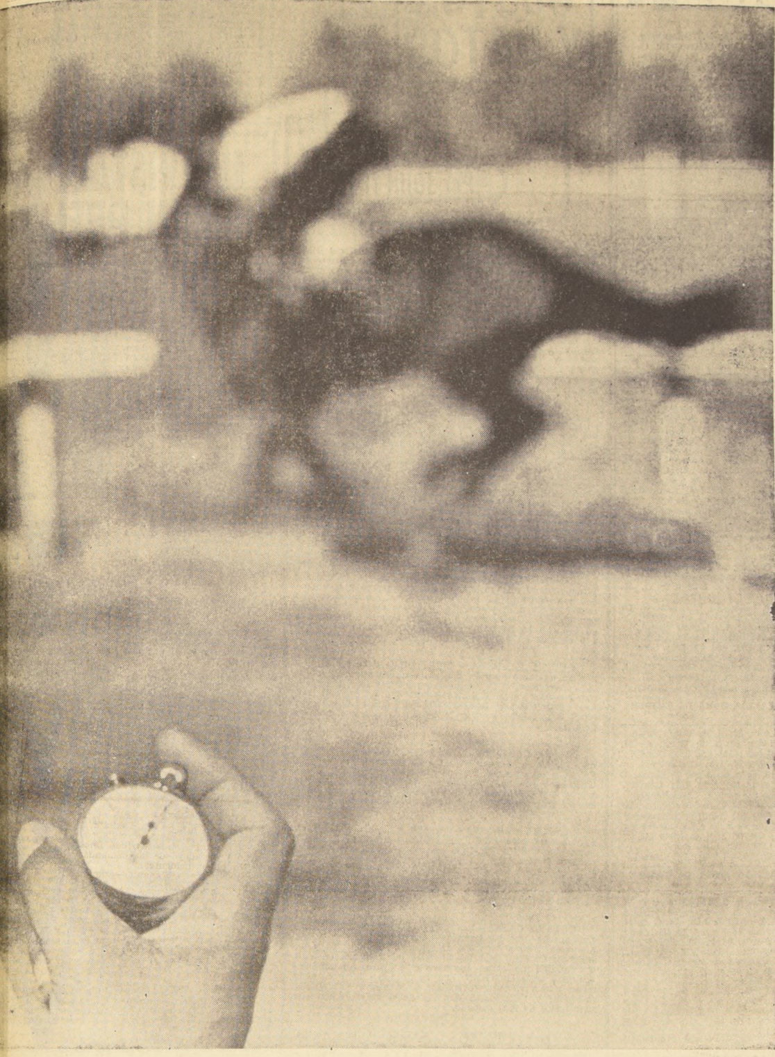
LAS AGUJAS corren. Cuando partió el ejemplar —que busca un tiempo— los dedos también señalaron la partida de las agujas. Muchos records, en muy poco tiempo.