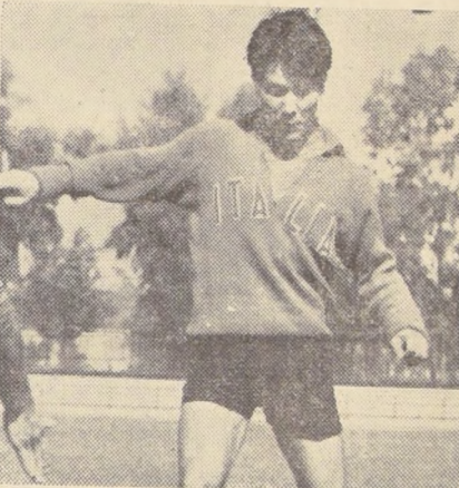
Afirma prensa peninsular