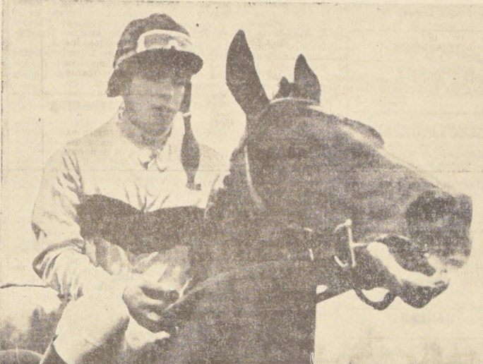
GRAN VITAL, ya está en la Ciudad Jardín preparándose para la Copa Jackson.