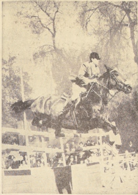
AMERICO SIMONETTI, con Strassburgo, también aportó a la tripleta de triunfos en el Latinoamericano Ecuestre de Viña del Mar...