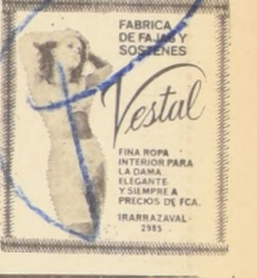
FABRICA DE FAMILIA Y SOSTENES Vestal