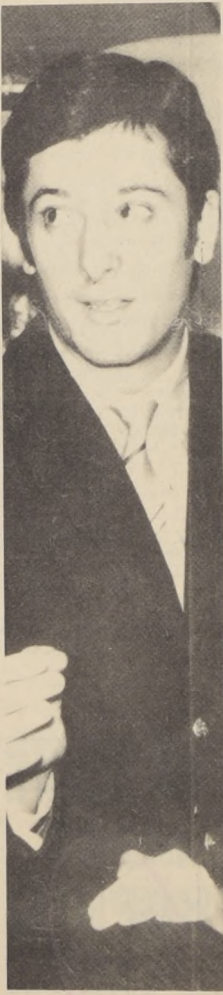
Vendiendo café se gana dinero y se conoce mucha gente.

Un último título: "Un Vagabundo que encontró su camino".