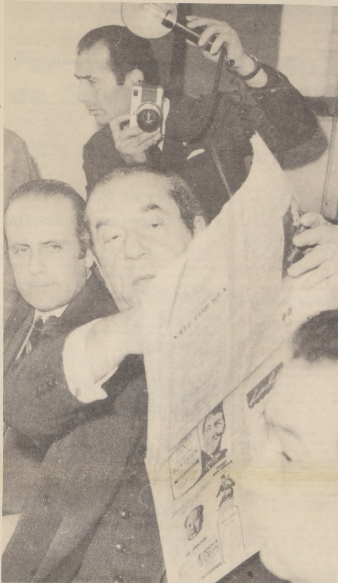
UNA DETALLADA cuenta de lo que fue su visita a Estados Unidos, donde entregó al Presidente Nixon el documento de CECLA, dio ayer a la prensa el Canciller Valdés. En el grabado, comprueba con diarios estadounidenses el éxito de su misión.