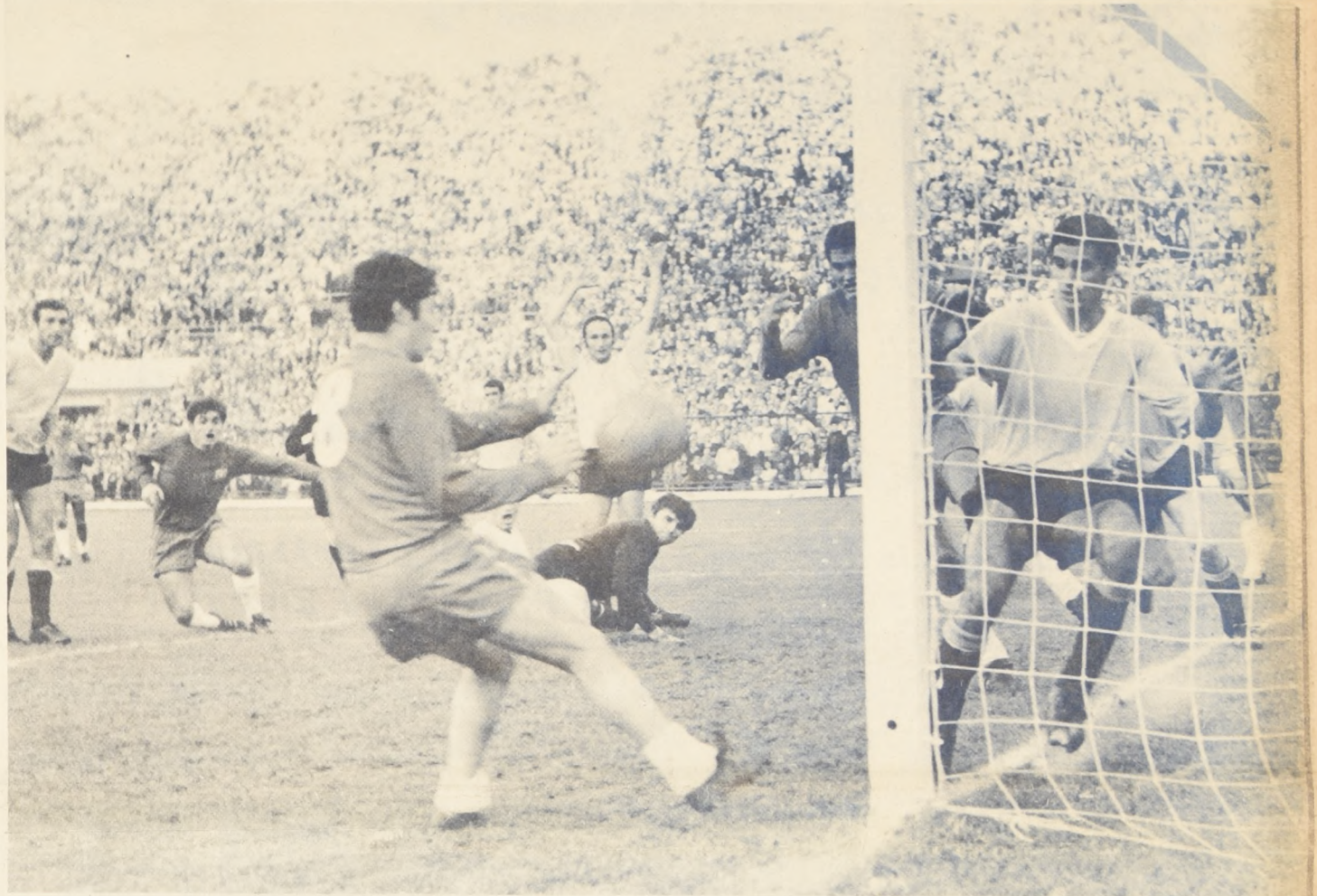
Dos oportunidades tuvo Chamaco de anotar un gol. Esta escena capta la jugada al final del partido. Mazurkiewicz está botado. Anchetta espera el disparo de Chamaco, Olivares ta'moien, antes hubo mano de Matosas. Al final Borssolino cobró foul.

Con el empate a cero, se afirman las posibilidades de uruguayos de llegar al campeonato Mundial de México, al paso que disminuyen las chilenas