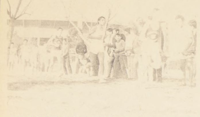
EL CROSS COUNTRY comienza a imponerse en las comunas. En el grabado un aspecto de la competencia realizada el domingo pasado en el Estadio Nacional.