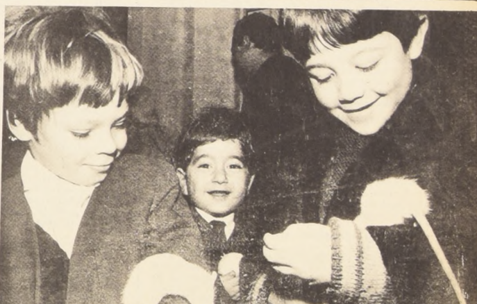
¿MIEDO, para qué?

Al término del año, los niños de la escuela para superdotados estarán en condiciones de ingresar a primer, segundo o tercer año básico. Pero no tendrán la edad reglamentaria para hacerlo. ¿No es una irresponsabilidad someter a estos niños a un entrenamiento de superdotados y entregarlos después al sistema común? — Llegar con ellos — dice Taibo con decisión — para abrir la puerta de la Universidad a empujones. Seguirán estudiando aquí. Serán ni-