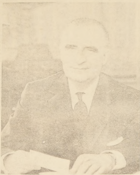
Presidente de Francia, Georges Pompidou, quien acaba de iniciar su periodo, sucediendo al General Charles de Gaulle.

Desde comienzos de 1959 hasta fines de 1967 sólo ha habido en Francia dos Primeros Ministros: el Sr. Michel Debré, del 8 de enero de 1959 al 14 de abril de 1962, y luego el Sr.