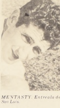
MENTASTY. Entrea de San Luis.

la sorpresa de la fecha al derrotar a amplia y merecidamente a Iberia de Los Angeles. No hay atenuantes para la derrota de los locales que cumplieron la peor actuación en lo que va corrido del certamen. El partido, en líneas generales, no gustó por acciones enredadas y confusas y porque el fútbol estuvo ausente. Sin embargo los porteros, haciendo muy poco, lograron estructurar un cómo lo marcador que refleja fielmente su superioridad y la baja experimentada por el equipo sureño.