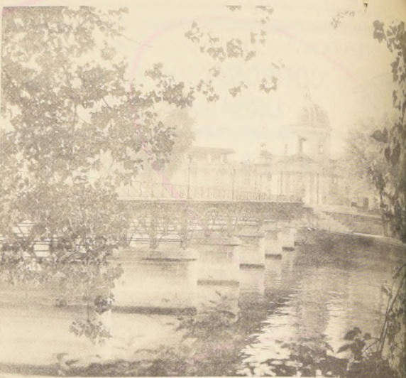
El Puente de las Artes y el Instituto de Francia.