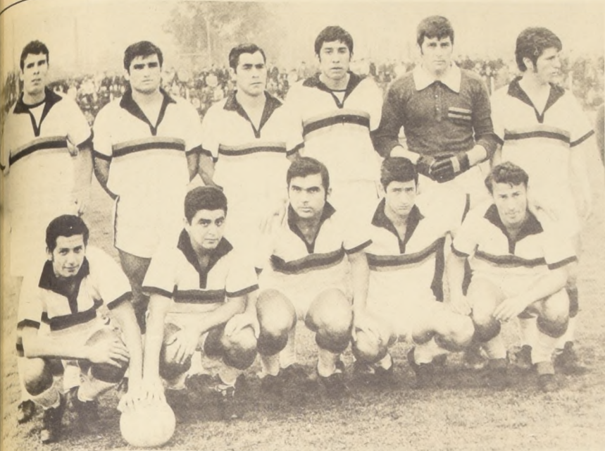
Programa del Ascenso