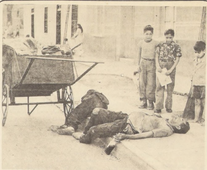
EL VICIO DEL ALCOHOL viene de los araucanos, según los estudiosos del problema. Estos recurrían a las bebidas fuertes, con todo tipo de pretextos. Bebiendo celebraban los triunfos bélicos o las derrotas. Penas y alegrías naufragaban en una bien regada fransachela y esto, a todos los niveles.