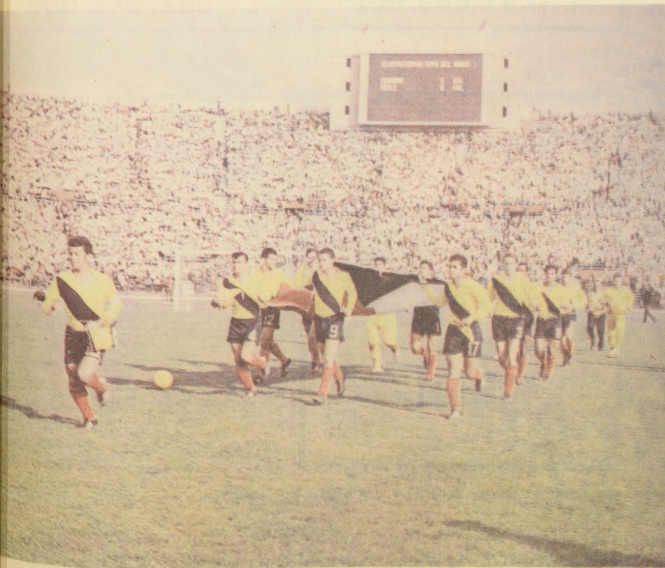
ECUADOR empequeñeció las posibilidades de una clasificación para nuestro equipo. En Montevideo el imperativo es ganar, nada más que ganar.

GUAYAQUIL. Agosto 3 (Especial para "La Nación").