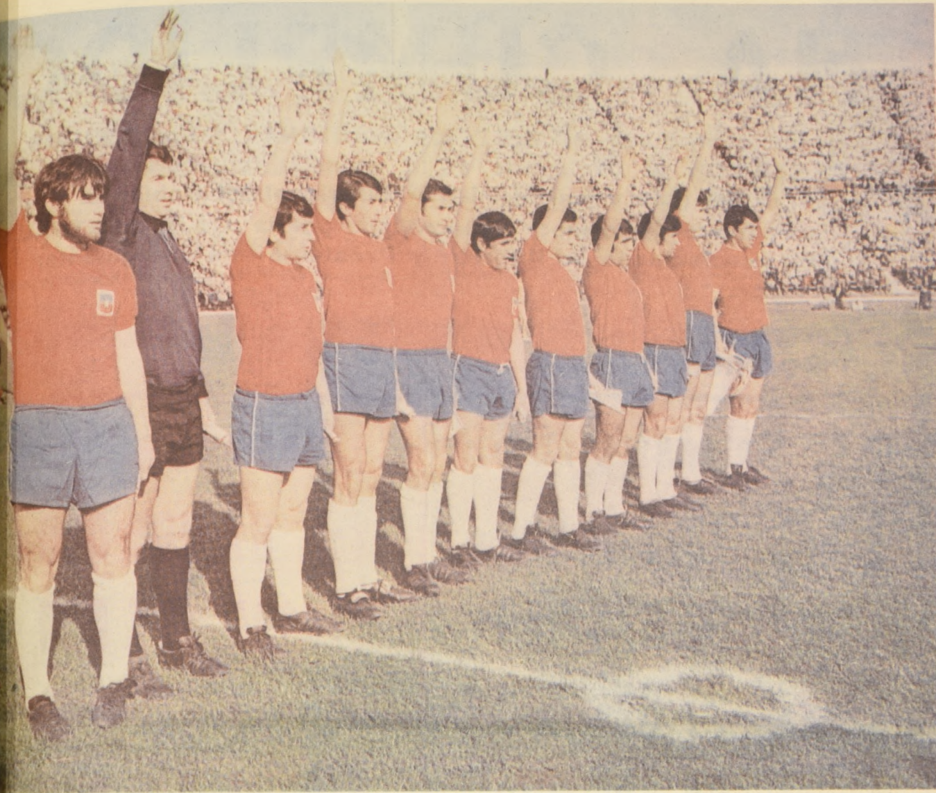
CHILE no pudo repetir el gesto triunfal en el Estadio Modelo de Guayaquil. Ecuador le complicó el partido y sólo pudo alcanzar un magro empate.