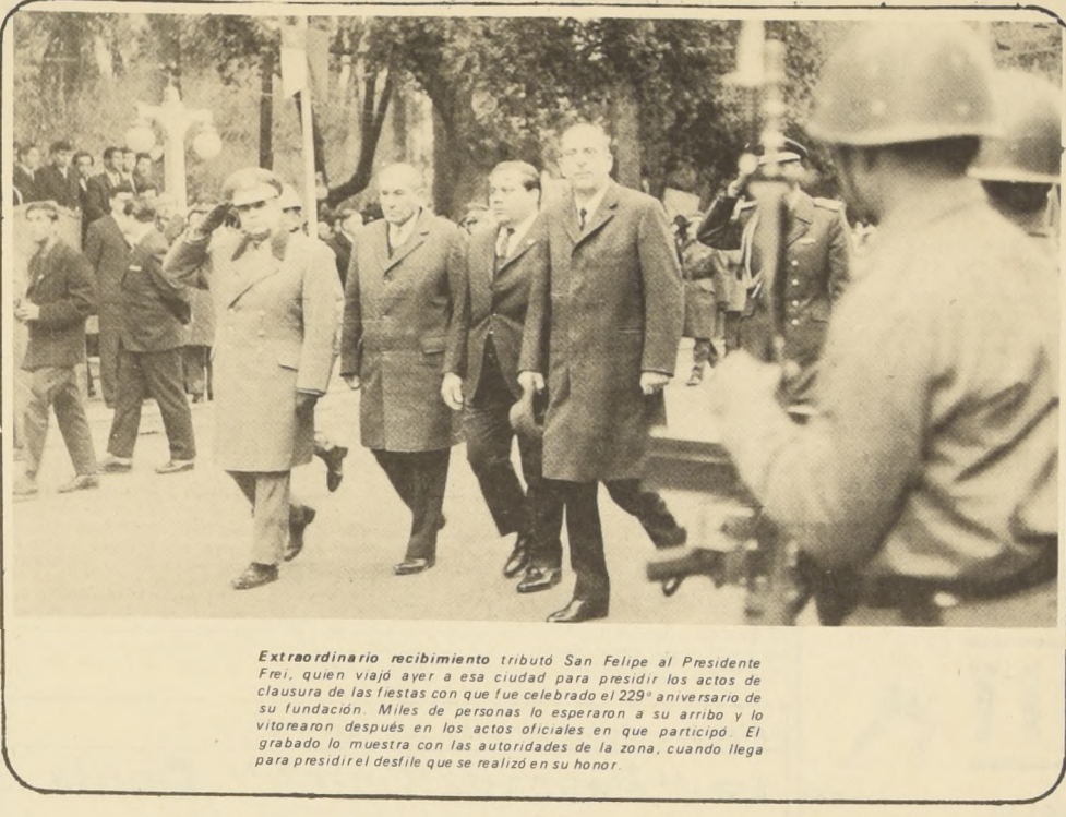
Extraordinario recibimiento tributó San Felipe al Presidente Frei, quien viajó ayer a esa ciudad para presidir los actos de clausura de las fiestas con que fue celebrado el 229º aniversario de su fundación. Miles de personas lo esperaron a su arribo y lo vitorearon después en los actos oficiales en que participó. El grabado lo muestra con las autoridades de la zona, cuando llega para presidir el desfile que se realizó en su honor.