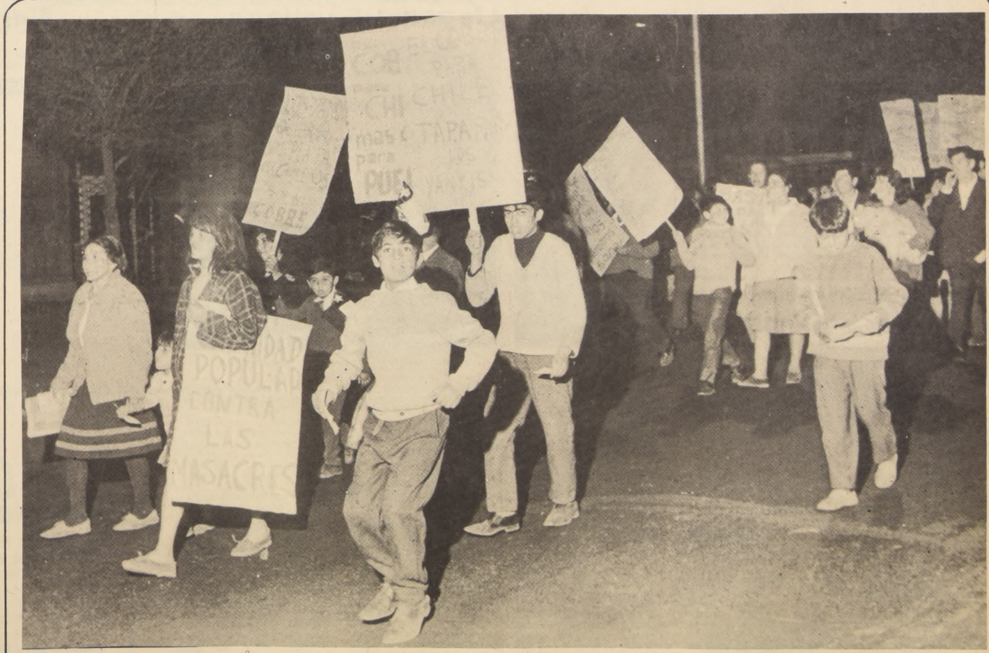
PARTE DE LA "MULTITUD" que logró reunir la marcha contra el imperialismo en el show montado audazmente por la izquierda durante la noche del jueves. Huelgan mayores comentarios y dejamos la escena a consideración de los lectores