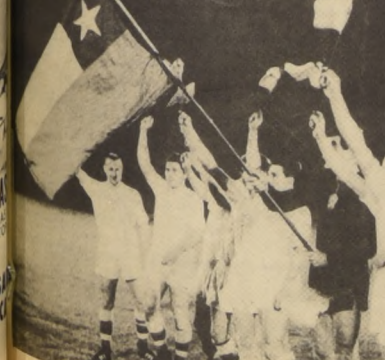
Checoslovaquia a punto de clasificarse. Un punto le basta para llegar a México. Juegan con Hungría en Praga.