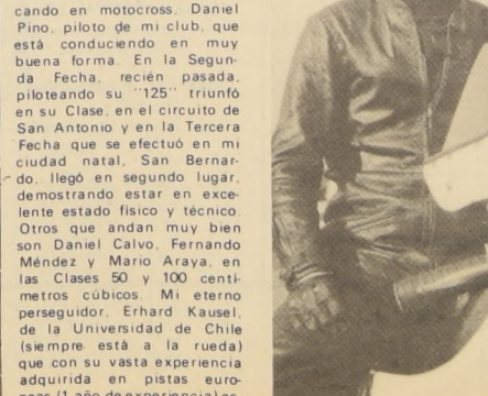
Kurt Horta. Triunfó en el motociclismo. Ahora busca prolongar su éxito en el automovilismo.