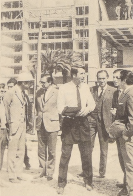
ANDRES DONOSO, Ministro de la Vivienda y Urbanismo, en mangas de camisa, recorrió detenidamente las obras del nuevo barrio Remodelación San Borja, que contará con torres de 22 pisos, 1200 departamentos y 4 mil viviendas para 20 mil personas, con equipamiento comunitario completo. El Ministro se informó en el terreno que las 12 primeras torres, de un total de 24, serán entregadas a partir de marzo del próximo año, y se mostró muy complacido por el avance de los trabajos de construcción.