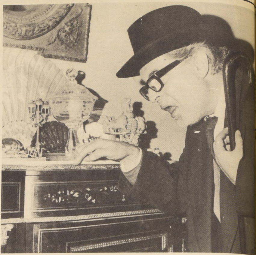
En el "El Precio" todos son directores:

Después de la sesión del miércoles en el Astor, dos músicos de su conjunto se trasladaron al Nahuel Jazz Club y estuvieron tocando allí, para deleite de los aficionados, junto a conjuntos criollos, hasta las cuatro de la madrugada.