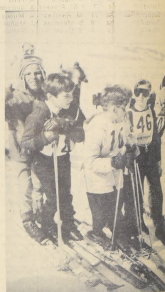
LOS MAS NUMEROSOS, en materia de representación fueron los niños del Colegio de los SS. CC., sin embargo pudieron superar en puntos al Colegio Grange varoncitos.

Los juveniles campeones anotaron 88,7 y los infantiles 114,7. Los de los SS. CC. sumaron con los mayores 96,8 y con los pequeños 133,7. Por eso la diferencia de 203,4 contra 230,5 en la clasificación.