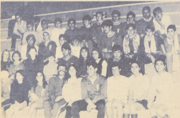
Grupo de nadadores de Universidad Católica que competirá en Mendoza.