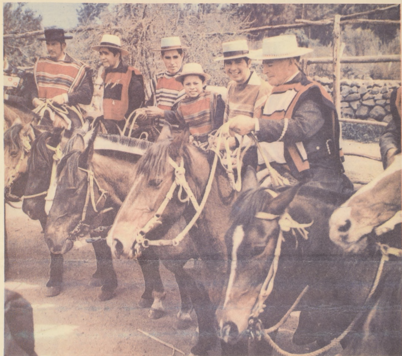
LUCIENDO MANTAS TAN LINDAS, COMO LAS GUINDAS, estos huasos del Club de Las Condes, se preparan para el rodeo oficial que se realizará, en la medialuna de Los Dominicos, hoy y