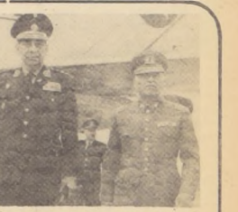
EL MINISTRO DE GUERRA de Perú y Canciller, General Ernesto Montagne llega a Pudahuel como invitado a las ceremonias del aniversario patrio. Lo acompañan el Ministro del Interior Patricio Rojas y el de Defensa Nacional, General (R) Tulio Marambio.