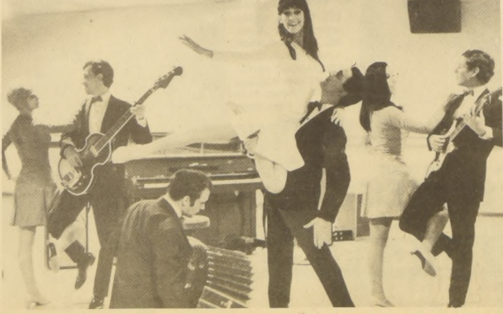
En esta escena, el grupo artístico argentino demuestra su versatilidad en su número de ballet. Los siete integrantes bailan acompañándose en bandoneón y guitarra eléctrica.