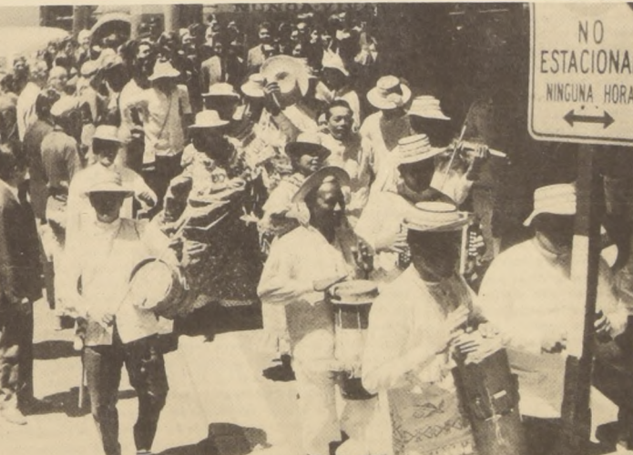
Toda la alegría y el ritmo de la música tropical invadieron ayer al mediodía las calles céntricas, cuando los treinta integrantes del Ballet Folklórico de Panamá abandonaron el ensayo del Teatro Municipal...