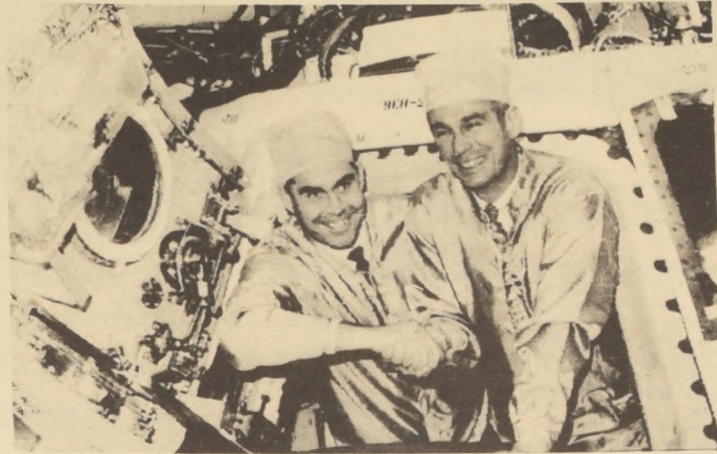
DOWNEY, California; El cosmonauta soviético, Mayor General, G. Beregovoy (izq), que se encuentra de visita al país, aparece junto al astronauta norteamericano Gene Cernan, examinando el interior de la Cápsula "Apolo - 16" que será utilizada en un próximo viaje lunar.

BEIRUT. 28 (ANSA) Una serie de explosiones sacudió hoy la capital libanesa, Beirut, luego que la calma relativa de ayer y anoche habían hecho creer en una rápida normalización.