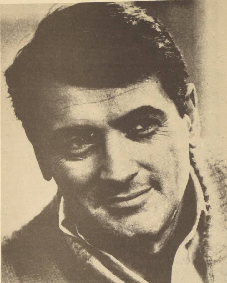
ROY SCHERER, llamado luego Roy Hudson, protagonista con Claudia Cardinale y conocido artísticamente en todo el mundo como Rock Hudson, protagonista con Claudia Cardinale de la comedia "Contigo Pan y Caviar"