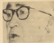
MANUEL BIANCHI: Chileno distinguido por su permanente defensa de los Derechos Humanos.