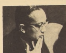
U THANT: Pese a los Derechos Humanos, conducta inhumana y cruel en el mundo de hoy.