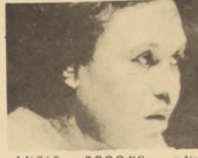
ANGIE BROOKS: No olvidemos que la Declaración es una de las más grandes proclamaciones universales.