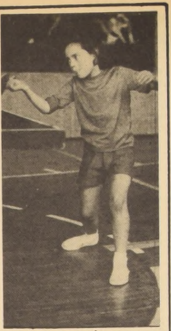
La mesa de pímpones casi de su porte. ¿pero que importa?