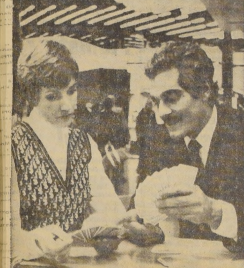
EL PROFESOR Y LA ALUMNA: El bridge no es un juego fácil de entender y Julie Andrews trata de aprenderlo con Omar Sharif. Ambos filman actualmente "Tamarind Seed", en Londres. Como se sabe, Sharif es un "as" en este juego y aprovecha los momentos de descanso de filmación para darle las primeras lecciones a Julie Andrews.