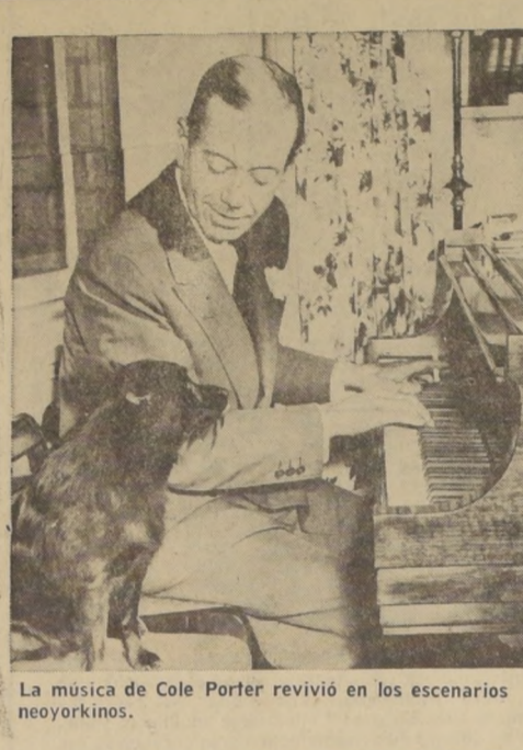
La música de Cole Porter revivió en los escenarios neoyorkinos.