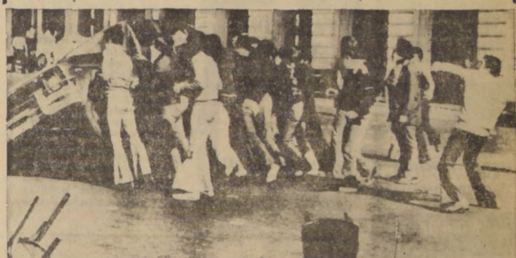
FROM: la tecnología moderna y el aislamiento fomentan la gresividad y la destrucción. (Radiofoto AP).