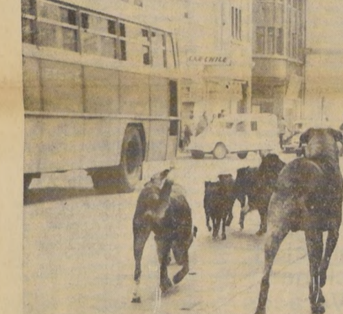
La falta de perrera desde hace ya casi un año, por causa de una oposición municipal en La Florida, ha hecho que el SNS no tome medidas activas contra los perros vagos. Para ir contra ellos debe hacerse bajo pedido firmado de los vecinos de un sector. Entretanto, hasta el centro de la capital se ve inundado por más de 200 mil perros vagos que pululan por Santiago. En todo Chile hay un millón de canes sin hogar