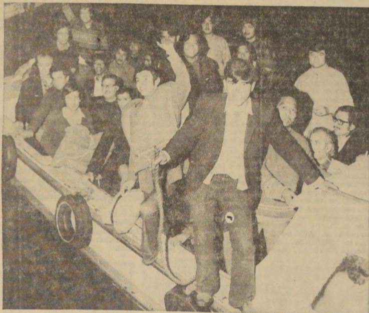
NAUFRAGOS DEL "AEGIS LION".— Parte de la tripulación del mercante "Aegis Lion" llega al Muelle Prat después de haber sido traídos a Valparaíso en el buque "Rio Abaucán", que los rescató en la zona sur del país. El "Aegis Lion" varó y posteriormente se hundió en el sector de Paso Tortuoso, en las inmediaciones del Faro Morrion, a ochenta millas de Punta Arenas. Ahora, los tripulantes, entre los cuales hay filipinos, griegos y chilenos, deberá prestar declaraciones en la Dirección del Litoral, la que está instruyendo el sumario para determinar las causas del accidente.