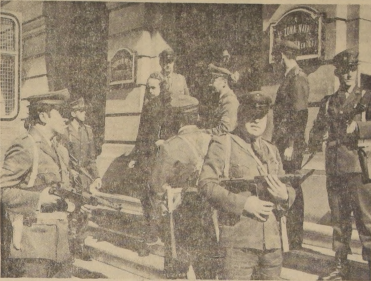
VALPARAISO - Sorprendido por difundir propaganda subversiva es trasladado hasta la Fiscalía Militar...