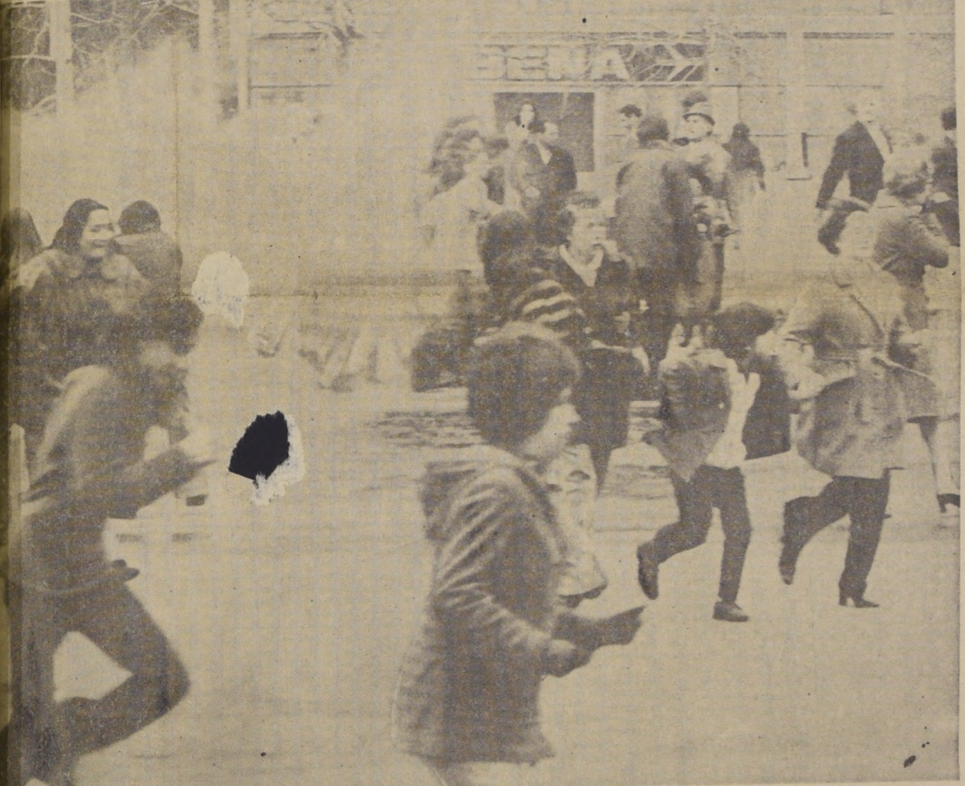
Imesperado ataque de fuerzas de Carabineros pone en fuga a niños, mujeres y curiosos en la Plaza de la Constitución, durante una concentración pacífica organizada por las esposas de los transportistas en huelga