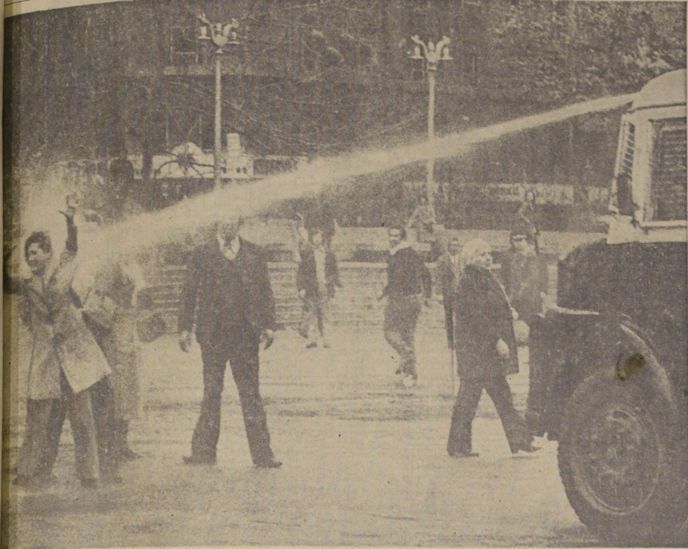
"guanaco" descarga un violento chorro de agua sobre la esposa de un transportista en huelga, en una insólita represión contra las mujeres, quienes, anteriormente, habían sido insultadas y atacadas por extremistas en la Plaza de la Constitución