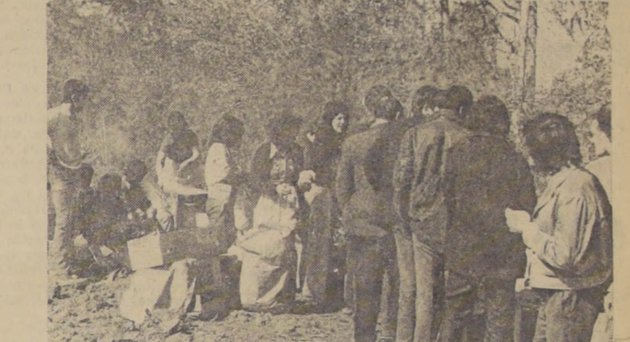
Transportistas hacen cola en pleno campo. Menú del día: tallarines.

¿Chile? Situación de post guerra: sin combustibles, con racionamiento alimenticio, muerte de frío, paralizado de norte a sur... Eso sí, un detalle: pasado inadvertido: aquí no hubo batalla visible alguna. Sólo que al país le abrieron un forado medio a medio, en el corazón de su economía. Y otro en el de la moral de su pueblo. Y está como viejo velero vencido, a la deriva. Y hace agua por sus cuatro costados.