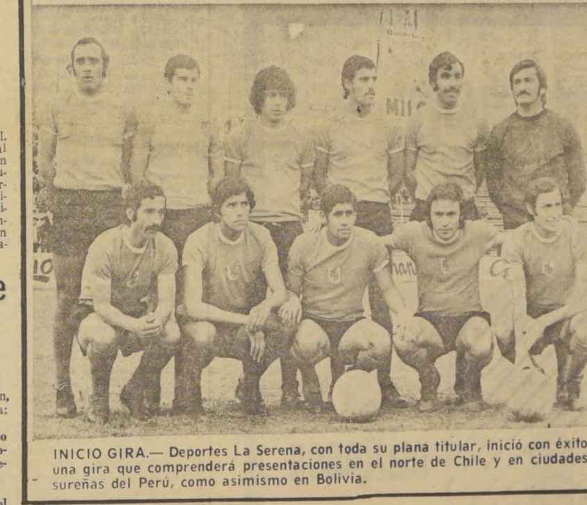
INICIO GIRA.— Deportes La Serena, con toda su plana titular, inició con éxito una gira que comprenderá presentaciones en el norte de Chile y en ciudades sureñas del Perú, como asimismo en Bolivia.

Tendrá la selección cinco meses limpios para trabajar en casa y estar lista y preparada para los compromisos sudamericanos —Copas tradicionales— y aceptar el calendario que se le ofrezca de Europa. Como el torneo local comenzará en una fecha cercana a las Fiestas Patrias (el 18 es una linda ocasión) julio y agosto serán los meses precisos para realizar giras a Europa y otros centros que seguirían interesándose en el fútbol chileno.