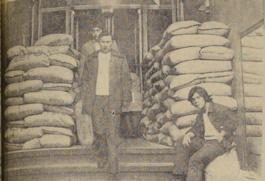
Sorpreza causó ayer en los transeúntes el encontrar estos sacos de azúcar en un lugar: el Ministerio de Obras Públicas. Amontonados en la puerta de acceso había no menos de 120 sacos.