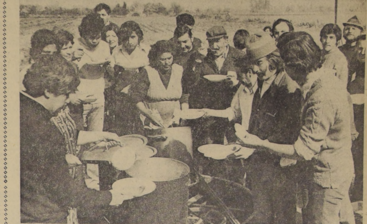
La olla común reúne a los camioneros al mediodía. Sus esposas son las encargadas de cocinar en los días del largo conflicto.

En una emotiva ceremonia efectuada en el aula de la Escuela Normal Superior "José Abelardo Núñez", recibieron su título de profesor de Educación Básica 120 maestros que se desempeñaban en calidad de interinos en diversos pueblos y ciudades del país, en su mayoría pertenecientes a la enseñanza particular.