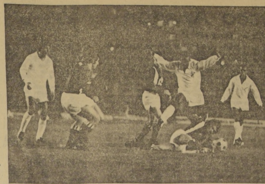
ESO YA PASO... Pelé lucíendose en aquellos Campeonatos de verano dejando rivales al paso del rey. La reestructuración del fútbol nacional modificando el desarrollo del torneo oficial dejará en el olvido a aquellos certámenes organizados por Ratínoff.