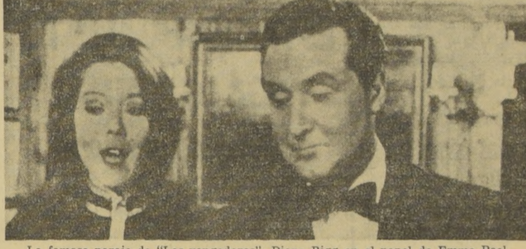
La famosa pareja de "Los vengadores": Diana Rigg en el papel de Emma Peel, y Patrick McNeen como el atildado John Steed. Ambos emprenden ingeniosas persecuciones de criminales, por lo general "guineolescos". Los tendremos de vuelta en la pantalla de Canal 13 en una fecha próxima.