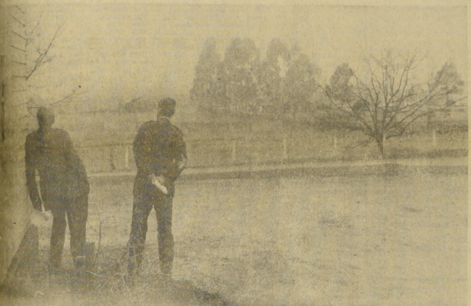
Personal del Grupo 3 de la FACH en Temuco, observa el desarrollo de las operaciones que se hacen en el interior de la cordillera de Nahuelbuta, provincia de Cautín. A los periodistas se les impide el acceso.