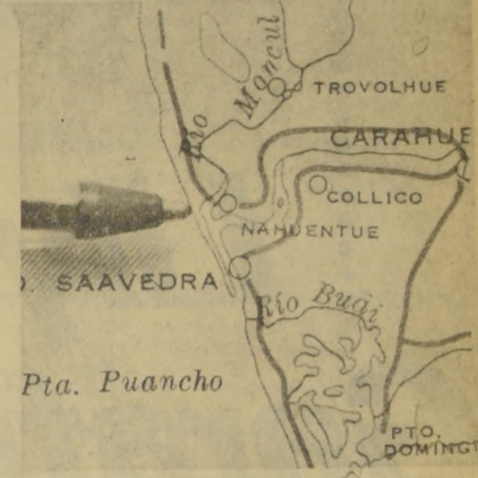
El grabado indica la zona en que se detectó el campamento guerrillero. Está ubicado en las cercanías del río Imperial, un poco al norte de Puerto Saavedra y al oriente de Temuco. Este foco tendría ramificaciones hasta Punta de Tirúa, parte sur de la Cordillera de Nahuelbuta