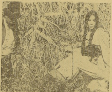
UNA escena de la serial nacional "Manuel Rodríguez", que desde el lunes 3, se transmitirá a las 21.30 horas.