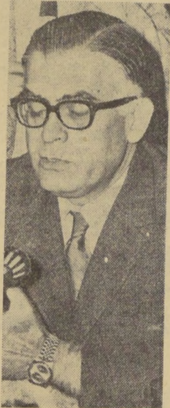
Radomiro Tomic Romero.

Me acuerdo que había un dirigente juvenil que no podía vivir sin hablar con él "por lo menos" tres veces por semana. De este dirigente ya nadie se acuerda.