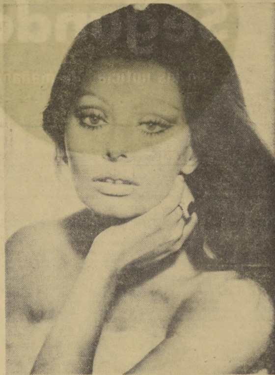
■ SOFIA LOREN, la bellísima actriz italiana, sigue manteniéndose en el primer plano del cine internacional. Respetada, querida y solicitada por muchos, ella se mantiene fiel a su tierra y a su marido, quien la descubrió y la aconseja en sus decisiones.