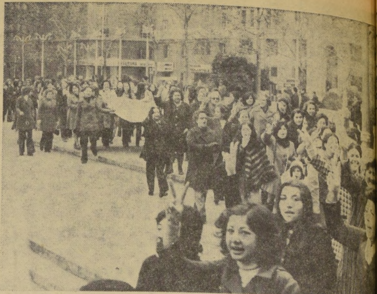
Las mujeres son, hasta el momento, las baluartes de la protesta democrática a lo largo y ancho del país.