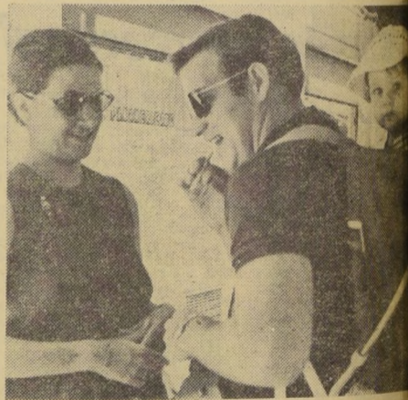
Los turistas traen generalmente al país utilidades, pero en ciertos casos, pareciera ser que éstas se vierten en otros.

(Fdo.) Javier Ossandón Correa, Director de Turismo".