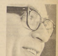
El texto de la alocución del candidato popular lo entregamos en esta página.

ma en que su Programa de Gobierno ensamble con las realizaciones del Presidente Frei y denunciando la descarada campaña de engaño y falsedades iniciada por el candidato del Partido Nacional, Jorge Alessandri, para tratar de lograr que la Derecha, los sectores patronales y monopólicos del campo y la ciudad, retornen al poder.