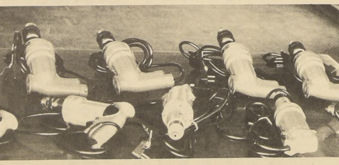
TALADROS ELECTRICOS de procedencia extranjera: el cuerpo del delito en contrabandos porteños.

El dinero fue recuperado en su totalidad y los tres jóvenes pasaron a disposición de la Justicia.