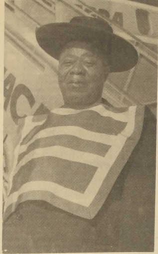
El Rey Satchmo en una de sus visitas a Chile.

—¿Qué fue lo dijo? Escríbame al respecto y entonces le contestaré.