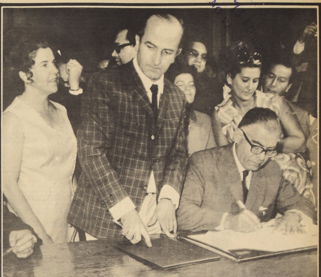
En medio del fervor popular quedó inscrito ayer en los Registros Electorales el candidato de la Democracia Cristiana Radomiro Tomic. Al grito de: "¡Jóven Chileno ¡Ni un paso atrás!", multitud de gente joven y mujeres le acompañó por las calles hasta la Dirección del Registro Electoral. El grabado superior muestra la firma de Tomic en el libro de Registros y el inferior, la forma en que la gente lo recibió a su llegada a la ceremonia.

Ya en la calle Huérfanos, entre Morandé y Teatinos, una multitud de adherentes, aclamó entusiastamente al abanderado del Partido Demócrata Cristiano y lo obligó a abrirse paso con mucha dificultad, entre los abrazos y saludos que cada uno quiso darle. Simultáneamente, los gritos alusivos al movimiento juvenil que apoya a Tomic junto al PDC se mezclaron con vitores a la persona del candidato. ¡Ni un paso atrás! y ¡No volvamos al pasado! fueron las consignas claves en el acto que, como característica fundamental mostró la gran cantidad de elemento juvenil o simplemente joven que apoya a Radomiro Tomic, y que llamó también la atención por el alto número de mujeres que le expresaron su simpatía.