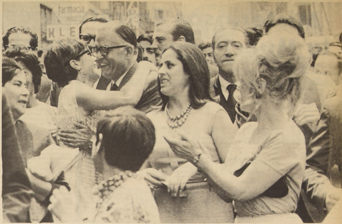
Al grito de "¡Joven Chileno, ni un Paso Atrás!" una multitud de muchachas y jóvenes acompañaron al candidato de la Democracia Cristiana, Radomiro Tomic, a efectuar la inscripción oficial de su postulación presidencial. Un extraordinario fervor espontáneo, de especial mérito el sector femenino, y la combativa presencia de la juventud, enmarcaron el acto político del mediodía de ayer. El grabado muestra una escena de la esquina de Ahumada y Huérfanos, en donde un grupo de muchachas universitarias abrazó y besó al líder DC en un gesto de extraordinaria simpatía.