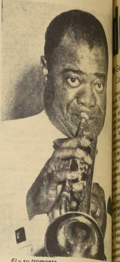
El y su trompeta.