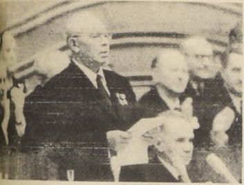
RUSIA. El jefe del Soviet Supremo de la URSS Nikolai Podgorny lee discurso en la ceremonia de celebración del 100avo Aniversario del Nacimiento de Lenin. La ceremonia realizada en el Palacio del Congreso del Kremlin contó con la presencia de los dirigentes soviéticos Leonidas Brezhnev, izq. y Alexei Kossyguin, derecha.

Los voceros militares dijeron que hoy se habían adoptado medidas adicionales ante el anuncio de una marcha sobre la plaza de Bolívar, que debía iniciarse a las dos de la tarde. El Gobierno y las Fuerzas Armadas ratificaron al medio día el parte de que "la situación está bajo control", pero es evidente que existe una inquietud latente. Durante toda la no-