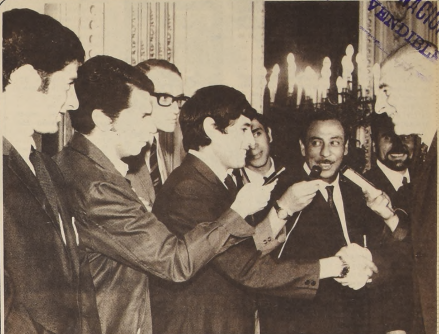
BUENA SUERTE EN MONTEVIDEO, desea el Presidente de la República, Eduardo Frei, a los jugadores de Universidad de Chile, que ayer lo visitaron para despedirse antes del compromiso que cumplirán frente a Nacional. El club universitario parte el 23 a