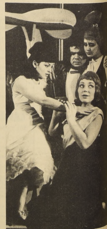
Escena de "Un Milagro Común", espectáculo montado por los estudiantes de la facultad de dirección de escena.

prácticas en dicho teatro también los futuros encargados de la guardarrropía, accesoristas, maquilladores. Todo en este teatro es obra de las manos estudiantiles: hoy ellos son artistas; mañana, maquilladores; pasado mañana, trabajan de obreros de escena o de acomodadores. El pequeño escenario del "Teatro-Escuela" parece un trampolín desde el que se da un salto hacia el gran arte. Muchos maestros de escena salieron de entre estas