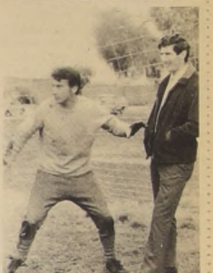
NEF: "Espérate flaco después te atiende. Estoy trabajando, tú estás de viaje hoy"