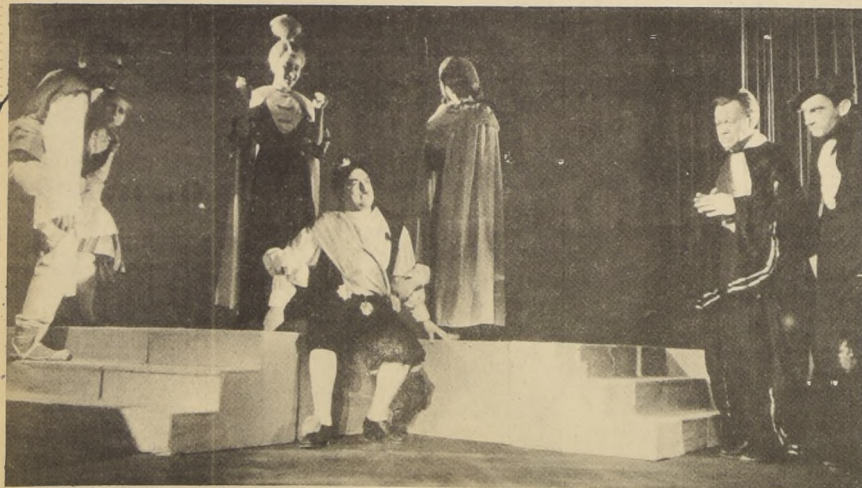
Otras escenas de "Un Milagro Común": siempre juventud.