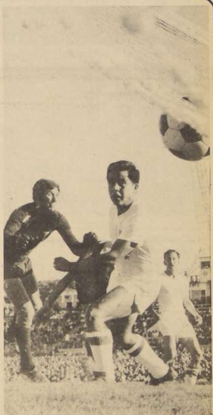
LIGA Universitaria defendió bien el uno a cero en Montevideo, pero terminó sucumbiendo ante el empuje proverbial de los uruguayos.