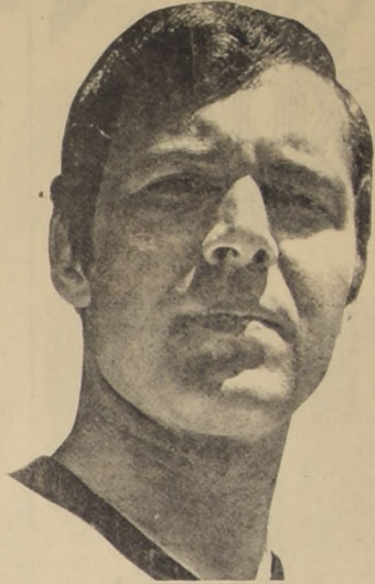
FRANZ BECKENBAUER, el formidable medio campista alemán, que hoy juega contra Italia.

Es una situación muy deplorable dijo el vocero de la Agencia.