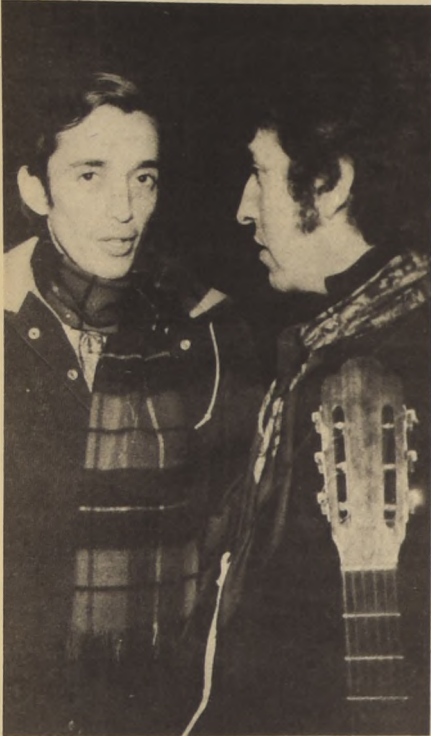
Patricio Renán y Víctor Jara dialogan mientras esperan su turno.