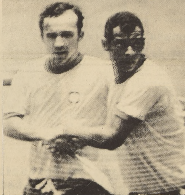
Tostao y Carlos Alberto, piezas claves de Brasil.