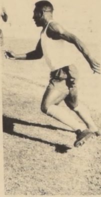
PELE será el principal problema para la defensa celeste

en la semifinal porque el jugador más peligroso y difícil de marcar de la delantera uruguaya está en la punta derecha. Siempre esperan algún suceso especial de la actuación de Luis Cubilla, el hombre que entregó el pase que Víctor Espárrago anotara ante la Unión Soviética.