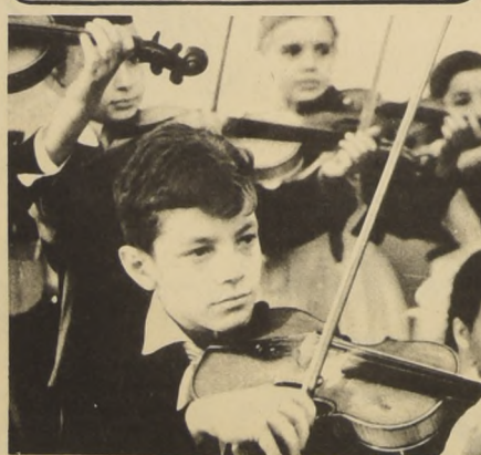
En la escuela de música para niños, en la ciudad de Mirna de la República Socialista Soviética.

¿Y ahora, otro éxito...? ¿Es lo que espero...? ¿Verdad que te vas a México...? ¿Está entre mis planes...? ¿Pero hemos escuchado que no te dejaron ir...? ¿por lo menos se que me quieren...? ¿Por cuánto tiempo es el contrato...? ¿por dos años...? ¿Creemos que te amarraste por mucho tiempo...? ¿noapino lo mismo. Tengo enorme fé en que me irá bien donde vaya. Ahora que podría tener una autorización para salir y volver...? ¿Por qué no cantas en serio, si tiene éxito...? ¿porque me siento muy cómodo haciendo show...? ¿Te gusta como te han recibido en el Perú...? ¿el que esté muy tranquilo aquí yo y mi familia está expandiendo si me gusta, como me siento, y porque sigo por estos lados...? Tomado de El Expreso de Lima. El diálogo es entre un reportero y Luis Dimas.