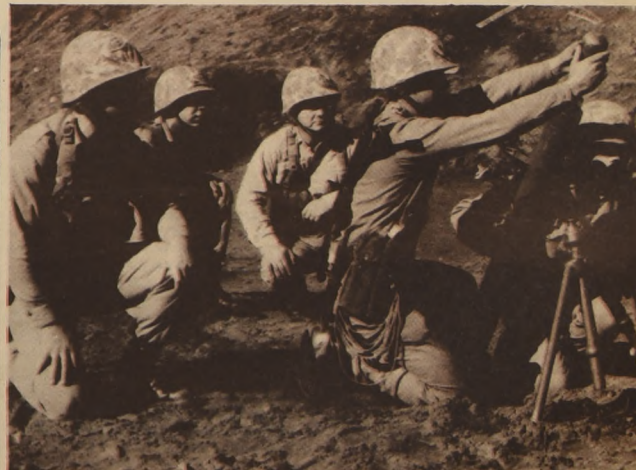
Ciento cincuenta y dos años de existencia cumplió la infantería de Marina de Chile, creado por decreto Supremo, General Bernardo O'Higgins, el 16 de Junio de 1818.

La nota decía: "Pedimos la transmisión inmediata de este comunicado porque la libertad del Embajador depende de la (a la pág. 6)