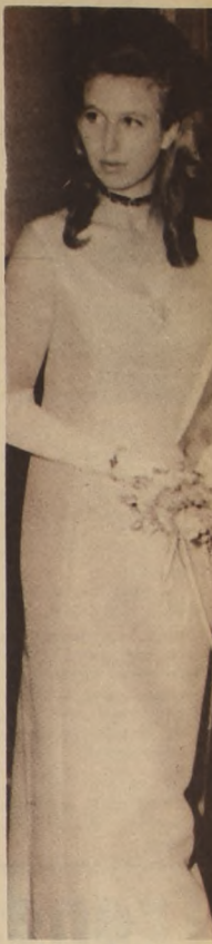
La Princesa Ana de Inglaterra luce como una verdadera modelo. Además es hermosa y elegante. Aquí aparece en la premiera de la cinta "Enigma Variations", luciendo un traje de noche de profundo escote. La película arrancó tantos aplausos como la joven hija de la Reina Isabel.