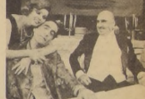
El señor Pontilla y Su criado Matti, ha sido de gran éxito en el Antonio Varas.