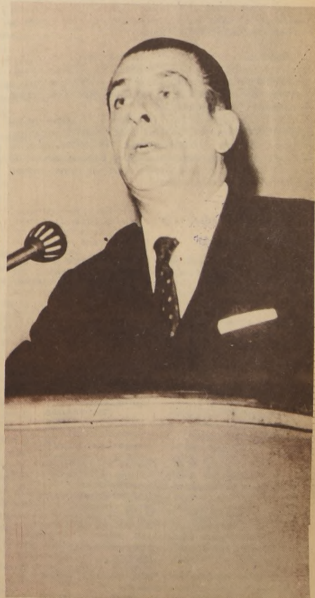
Importantes medidas en beneficio de los sectores modestos del país anunció anoche el Presidente Frei en materia habitacional, destacando el esfuerzo gigantesco de su Gobierno en este campo.

Informaciones no confirmadas oficialmente dan cuenta que entre las diez personas que llegaron a Arica, se encontrarían algunos chilenos.