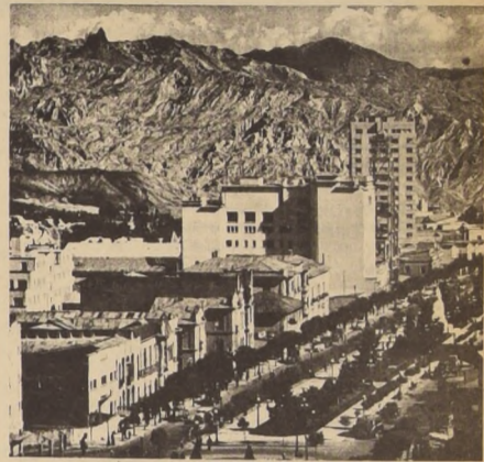
La Avenida principal de la Capital boliviana, llamada Prado, y muy parecida a nuestra Alameda, escenario de los sangrientos incidentes estudiantiles registrados ayer cuando grupos universitarios derechistas lanzaron un ataque y ocuparon la Universidad de Los Andes.