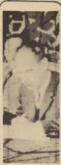
Presidente de Bolivia dio libertad a diez presos políticos a cambio de dos técnicos alemanes rehenes