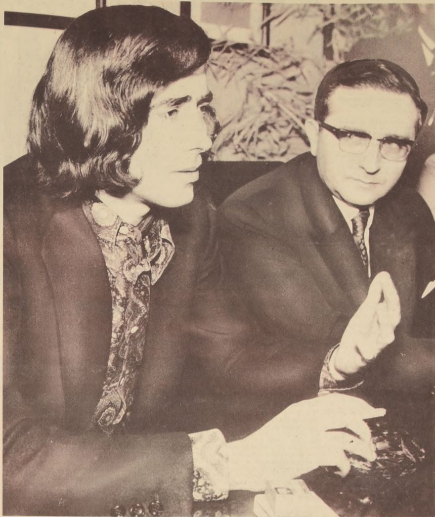
Como gran poeta y gran cantante presentó el Ministro de Educación, Máximo Pacheco, al artista catalán Joan Manuel Serrat, quien aparece en el grabado junto al Secretario de Estado, durante la conferencia de prensa de ayer. Serrat llegó por tercera vez a Chile y en esta oportunidad sostendrá un encuentro con la juventud chilena.