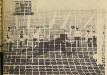
Se desperdició el penal, el mismo pudo darle la Universidad Católica.