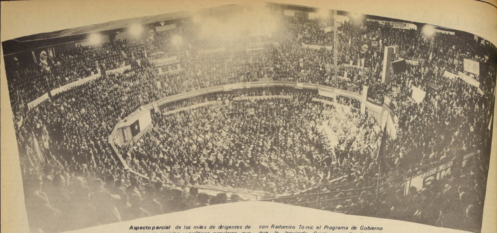
Aspecto parcial de los miles de dirigentes de organismos sociales y políticos populares, que repletaron el Teatro Caupolicán para reafirmar con Radomiro Tomic el Programa de Gobierno que la Izquierda Cristiana realizará continuando la labor del Presidente Frei.

Con la participación de miles de dirigentes populares