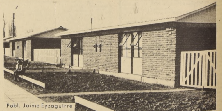
Pobl. Jaime Eyzaguirre

Los Departamentos y Viviendas podrán ser visitados por los interesados los días Sábado y Domingo.