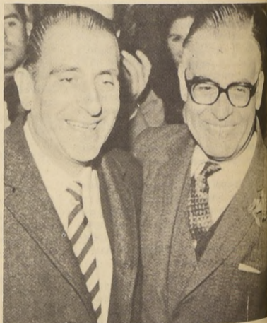
Frei y Tomic los dos grandes líderes populares a quienes la Derecha trata inútilmente de mostrar divididos

Nunca dijimos que en 6 años quedarían resueltos todos los problemas de Chile. Y no tenemos vacilación para expresar que la más alta medida de un pueblo es su capacidad para aprender no solamente de sus victorias, sino también de sus errores o sus fracasos.