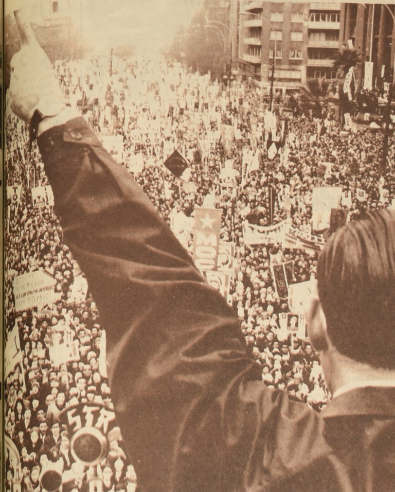
Las muchedumbres rodean a Radomiro Tomic en el largo y ancho de Chile. Hombres y mujeres entusiastas, respaldando al candidato de la Democracia Cristiana y su programa de amplia participación popular. Esas muchedumbres están representadas en las encuestas y en los

Fundado el 14 de enero de 1917 Año LIV, Nº 19.247