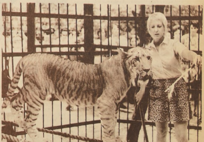
"Tiglón": mitad tigre mitad león

respecto a nuestra actitud frente a la integración subregional. Lo contrario es sucumbir bajo la presión del egoísmo de grupos cortos de vista, contrarios al auténtico desarrollo del país."