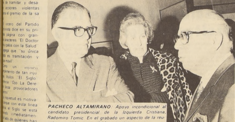
PACHECO ALTAMIRANO: Apoyo incondicional al candidato presidencial de la Izquierda Cristiana, Radomiro Tomić. En el grabado un aspecto de la reunión sostenida en casa del famoso pintor.

El Instituto Nacional del Libro se relacionará con el Gobierno a través del Ministerio de Educación.