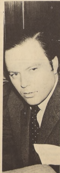
"Creo que este tipo de informaciones tienden a crear alarma en la opinión pública", señaló ayer el Subsecretario de Relaciones Exteriores, Patricio Silva Alessandri, frente a las noticias publicadas por órganos periodísticos sobre presuntas amenazas de secuestro a diplomáticos.

pública - señaló el Subsecretario - por lo que es necesario aclararlas. Añadió que la Cancillería en conocimiento de algunos "rumores periodísticos" pidió al Ministerio del Interior que se adoptaran medidas especiales de vigilancia en esa Embajada. Destacó que a pesar de ser sólo rumores, el Ministerio de Relaciones Exteriores, previendo la posibilidad de su veracidad, adoptó las medidas necesarias para otorgar todo tipo de seguridad a esta representación diplomática. La Embajada de Francia, ante esta actitud de la Cancillería chilena, ha expresado sus agradecimientos por las medidas adoptadas. El rumor del posible secuestro del Embajador francés por elementos de la extrema izquierda, según ha trascendido, tuvo su origen en los propios círculos diplomáticos a raíz de declaraciones de un representante extranjero, y fue recogido por la prensa de derecha y el principal vocero del comando Alessandri, Rafael Otero. Esta campaña queda claramente de manifiesto por la conclusión a la que llega la información publicada en la edición de ayer del Ilustrado, ha sido desbaratada al comprobarse la inexactitud de las afirmaciones, pero no deja de crear preocupaciones en círculos de Gobierno y el que se efectúen este tipo de maniobras.