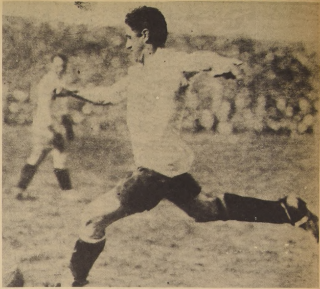
El derechazo va a salir y con él... el gol...