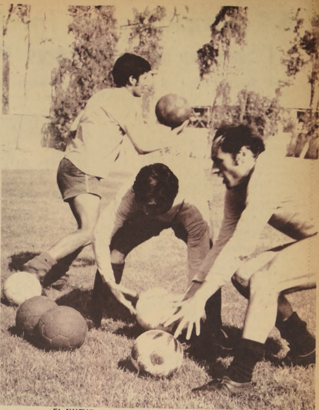
EL NUEVO representante nacional se prepara en "Pinto Durán".