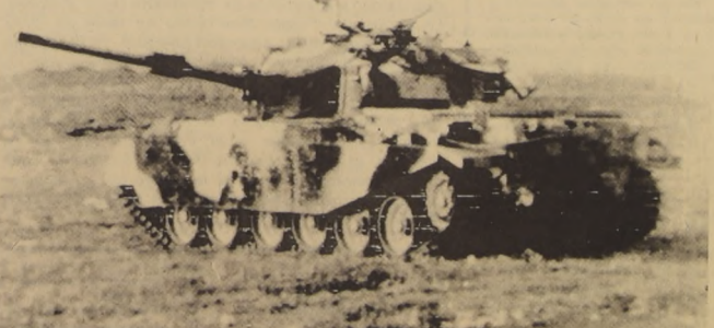
RAMTHA: JORDANIA. Tanque jordano listo para entrar en acción después del ataque que se inició como un acción de guerrillas, comenzó lo que puede transformarse en una conflagración que envolvería el Medio Oriente. Numerosas son las bajas anunciadas después del primer ataque.

TASS se limitó a decir que la estación automática había "comenzado a hacer estudios de la superficie lunar" y que el punto preciso en que había alunizado, en coordenadas selenográficas, se hallaba a cero grados 41 minutos latitud sur y 56 grados 18 minutos longitud este.