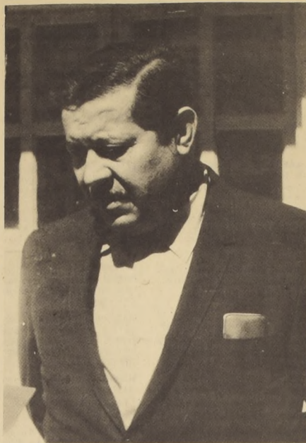
La radio une a todos los chilenos.