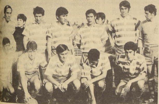
Unión San Felipe, un equipo provinciano que se puso pantalones largos.