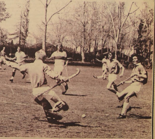
DELANTEROS del once campeón apremian al arquero argentino de Banco Provincia de Buenos Aires.