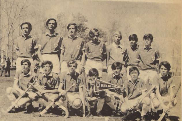
HURLING DE BUENOS AIRES. Fue el equipo más capaz del internacional múltiple finalizado ayer.