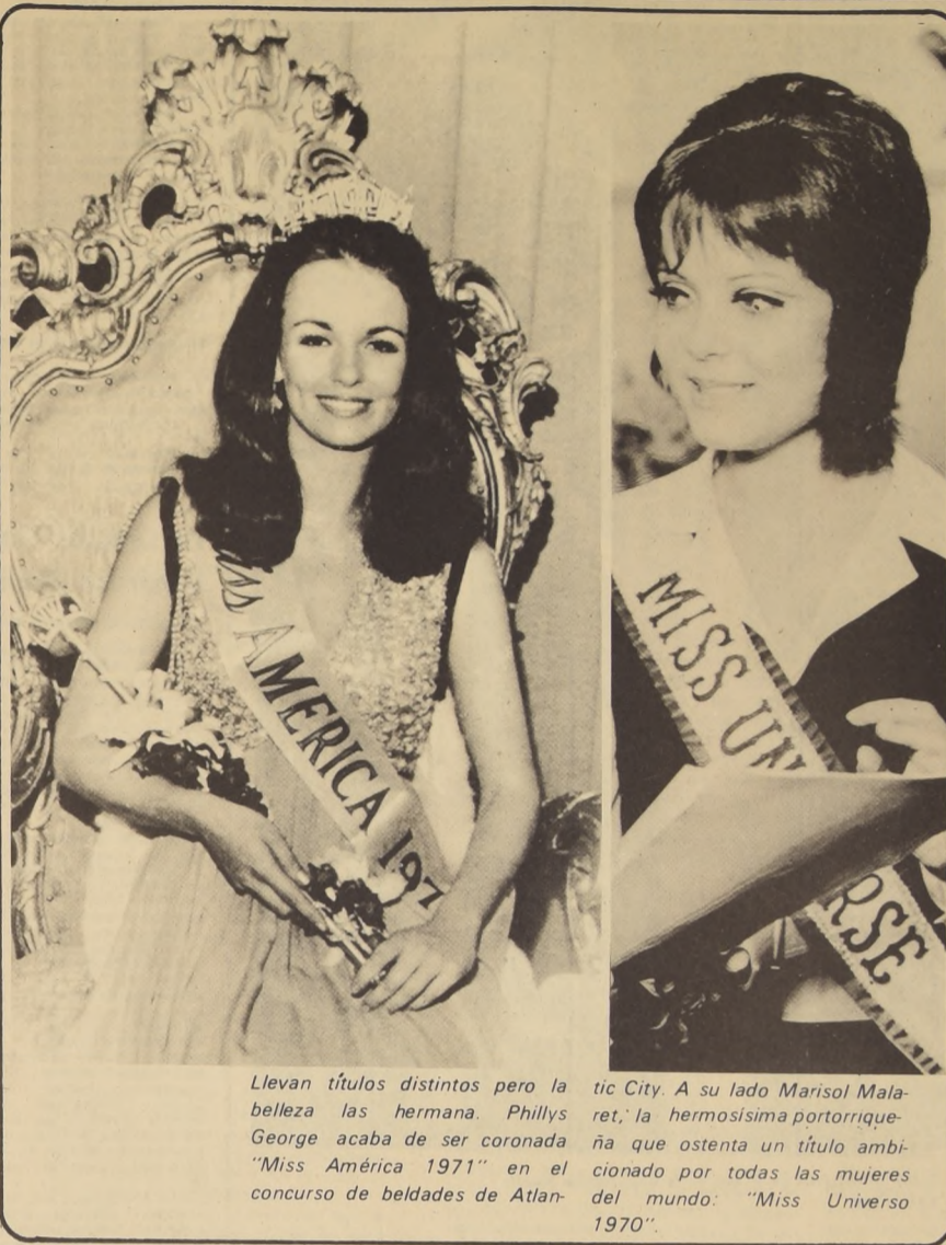
Llevan títulos distintos pero la belleza las hermana. Phyllis George acaba de ser coronada "Miss América 1971" en el concurso de bellezas de Atlantic City. A su lado Marisol Malaret, la hermosísima portorriqueña que ostenta un título ambicionado por todas las mujeres del mundo: "Miss Universo 1970".