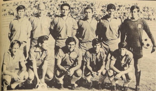
Ultima selección chilena que jugó frente a Brasil.

Aunque figuramos en forma muy desnivelada entre triunfo y derrota, el 4 de octubre puede repetirse lo de Montevideo, el 4 a 1 que nos engorguleció.