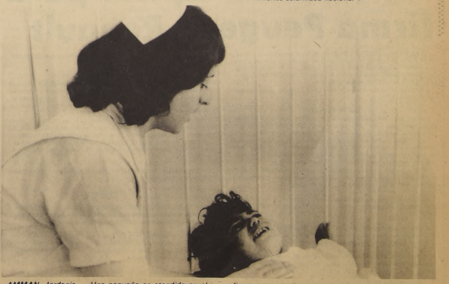
AMMAN, Jordania.— Una pequeña es atendida en el Mausher Hospital, durante los convulsivos días de la guerra civil en Jordania, a cuyo término contribuyó eficazmente el desaparecido líder del Mundo Árabe, Nasser. La niña es una de las veinte o treinta mil víctimas de la lucha fratricida.

Con respecto al futuro, subrayó que le gustaría ser Director y, probablemente, ofrecer un espectáculo por año, posiblemente en la televisión.