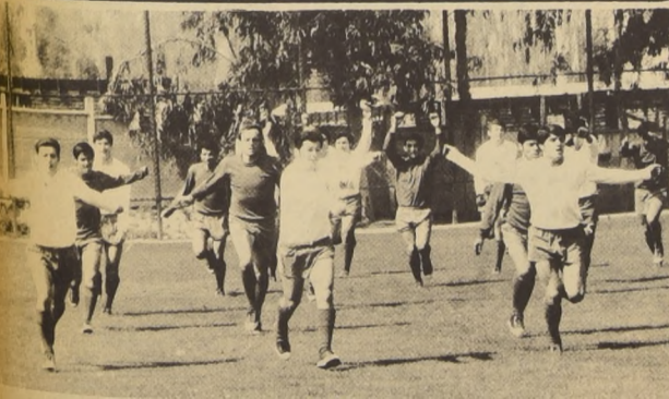
Un poco de gimnasia para saltar los músculos. Esta tarde el seleccionado enfrenta a la selección juvenil metropolitana.