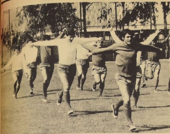
La selección no paró su entrenamiento. Ayer en la mañana realizaron gimnasia suave y en la tarde hicieron 40 minutos de fútbol.