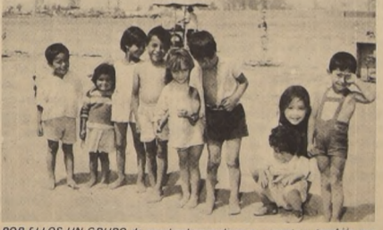
POR ELLOS UN GRUPO de muchachos realizaron un rapto y, también por ellos, las Juntas de Vecinos de la Población La Bandera se organizan, piden, luchan por conquista tales como escuela, policlínica, alcantarillado, agua potable, luz, etc.