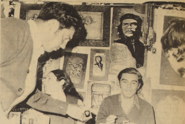
EL CHE ESTA en los muros, en las mesas, en todas partes. Carlos Baeza dice: "No se vende otra cosa, sino el Che".

● Texto de Licha Ballerino Fotografías de René Barra