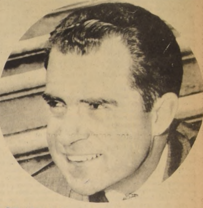
RICHARD NIXON, presidente de USA, ríe, porque está feliz haciéndose el sordo. Escucha lo que le conviene.