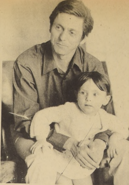
GOBERNADOR DEL DEPARTAMENTO PEDRO AGUIRRE CERDA; "Queremos que la población conozca lo que está haciendo el Gobierno de la Unidad Popular."