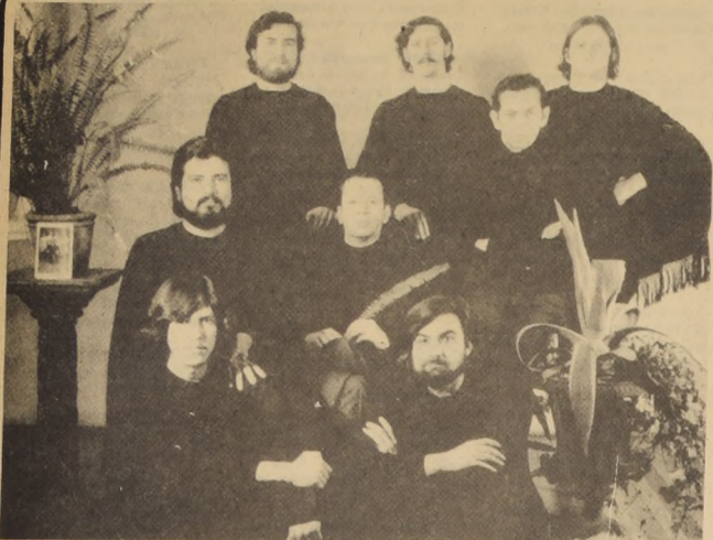
QUI LAPAYUN, conjunto nacional que viaja por el exterior y nominado para recibir los premios APES. Su labor durante el año que está terminando fue muy positiva y de gran proyección.