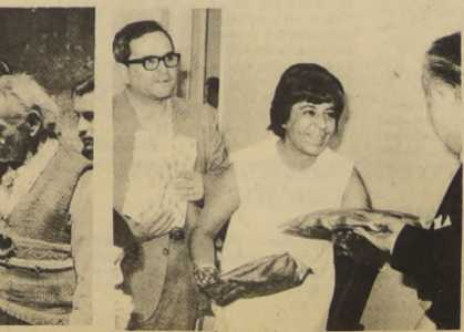
LA ESPOSA del Ministro del Trabajo entrega regalos a los hijos de los funcionarios de ese Ministerio en una pequeña fiesta que se realizó en homenaje a la Pascua.