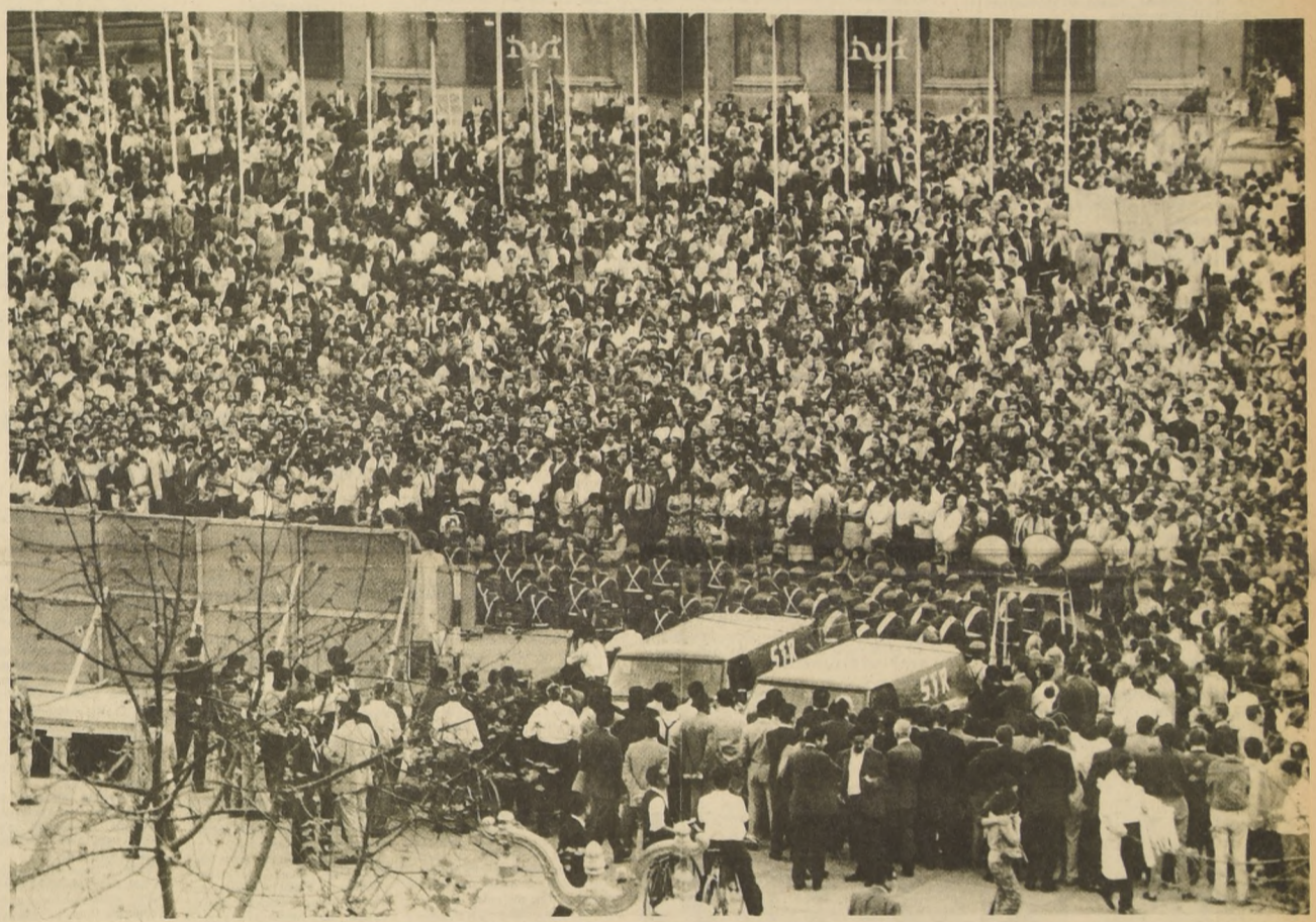
UNA IMPONENTE MULTITUD se dio cita en la Plaza de la Constitución para escuchar la voz del Compañero Presidente, anunciando la feliz nueva de que el cobre de la Patria es para los chilenos, de ahora en adelante.