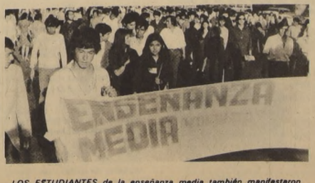
LOS ESTUDIANTES de la enseñanza media también manifestaron su decisión inquebrantable de entregar el mayor aporte para la cristalización final de todas las tareas emprendidas por el Gobierno del Presidente Allende.

Aprobado 'Estatuto de Garantías' POR 127 VOTOS a favor y 24 abstenciones, el Congreso Pleno ratificó las Reformas Constitucionales aprobadas con anterioridad por la Cámara de Diputados y el Senado a favor del llamado "Estatuto de Garantías"; votaron los parlamentarios de la Democracia Cristiana, de la Unidad Popular y la Democracia Radical; la abstención correspondió a diputados y senadores del Partido Nacional.