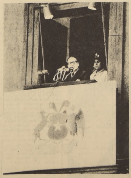
ALLENDE habla al pueblo de Chile para dar cuenta de la decisión soberana de nuestra patria de nacionalizar su cobre, haciéndose, así, dueño de su destino económico