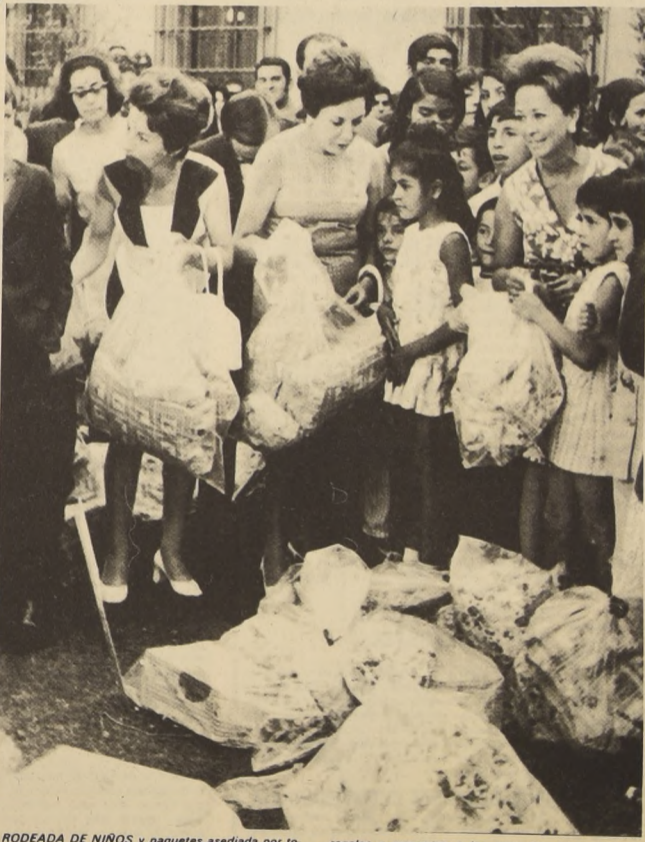
RODEADA DE NIÑOS y paquetes, asediada por todos lados, se vio ayer la Primera Dama de la Nación, Hortensia Bussi de Allende, al entregar regalos y presentes a los pequeños hijos de los funcionarios de Moneda. Los niños repletaron de risas y juegos los quietos patios de La Moneda.