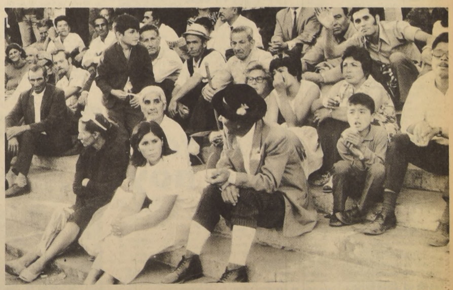
OBREROS, campesinos y estudiantes se unieron ayer frente a La Moneda para cambiarle el rostro a Chile. Un nuevo futuro económico se hizo realidad ayer al firmar el Compañero Presidente, doctor Salvador Allende, el proyecto de nacionalización del cobre. Nuestro país marcha ahora por la senda del progreso.