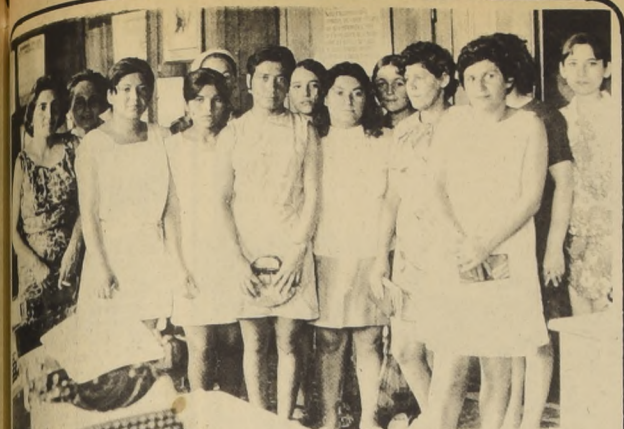
El Poder femenino se manifestó en el Hipódromo Chile. Las esposas de los jugadores de caballos saltaron a la palestra para defender los intereses de sus maridos.

R.— En el aspecto internacional nuestro gobierno por el respeto a los tratados vigentes, y sobre todo por llevar adelante este nuevo temperamento frente a la integración. Creemos que aunque nos llamemos un gobierno nacionalista, nuestro nacionalismo no se limita a nuestras fronteras. Nuestro nacionalismo tiene que ser latinoamericano. Las condiciones de nuestros pueblos son similares, existen muy pocas diferencias. Somos países dependientes, y el problema consiste en resolver, de una vez por todas, la independencia de América Latina, y la única forma de dar viabilidad a esto es precisamente la integración.