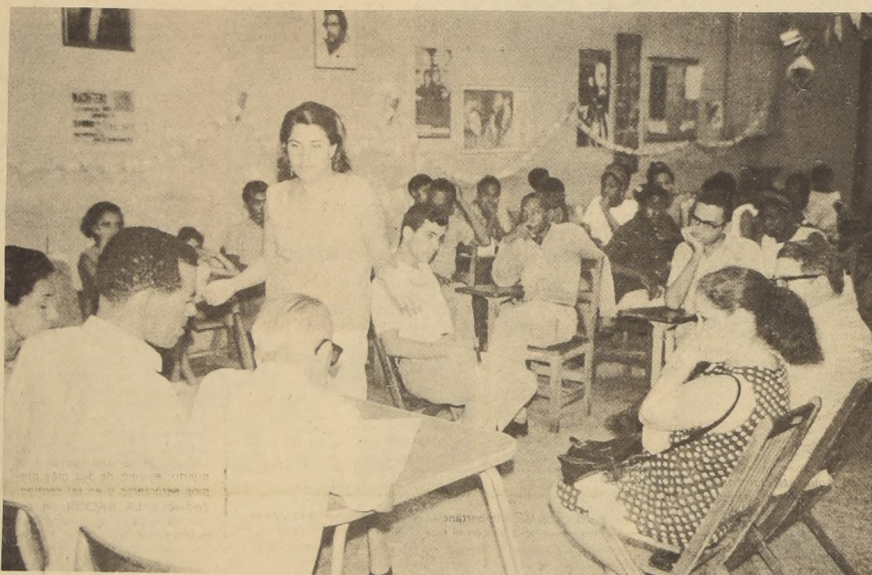
SE HA querido mostrar a los Tribunales Populares como una espeluznante guillotina, donde los "tricotouses" se deleitarían con la decapitación de los indefensos contrarrevolucionarios. Todo esto es totalmente alejado de la realidad. Los Tribunales Populares...

— ¿Recuerda usted cuáles fueron los primeros tribunales que se constituyeron?