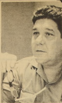
EL DOCTOR Agustín Moya Pupo, Director Nacional de los Tribunales Populares de Cuba.

"Sí, el tribunal puede privarlo de libertad con confinamiento (en cuyo caso se le interna en una granja agrícola; allí recibirá remuneración habitual y cumplirá sus tareas como los trabajadores permanentes y voluntarios que concurren a esa granja) y sin confinamiento (se le señala algunas labores concretas a realizar, por ejemplo, ir diez domingos a trabajar a a agricultu-