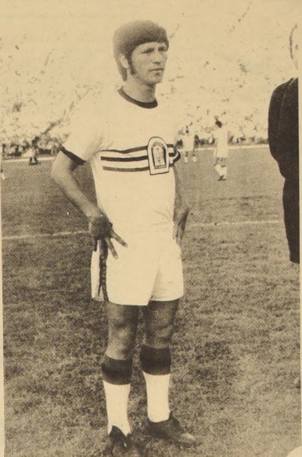
Azúcar, buena oportunidad para confirmar sus progresos frente a Colo Colo.

podrán producirse hoy a las 20 horas cuando se dé comienzo a otra noche de liguilla, que busca al campeón y vice del fútbol chileno y de paso a, los dos representantes de nuestro país a la Copa Libertadores de América