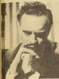
Una comedia diferente "Departamento sin muebles para el amor" con Américo Vargas.