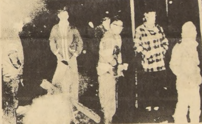
HYDEN, Kentucky. La peor catástrofe minera sufrida por Kentucky al quedar atrapados 39 mineros por explosión, conmovió intensamente a los habitantes de la zona. En el grabado, parientes y amigos de los mineros atrapados esperan en ansiosa vigilia noticias de los obreros.

"Socialismo y paz son hoy las fuerzas directrices que caracterizan el movimiento de numerosos pueblos en el mundo", así declaró Allende. Esta "es una verdad que será más evidente el año que está por comenzar". Al concluir la entrevista, el Presidente chileno deseó al pueblo soviético y a sus dirigentes "nuevos éxitos" en el camino hacia una sociedad mejor.