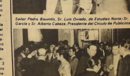
Vista gráfica parcial de la animada concurrencia.