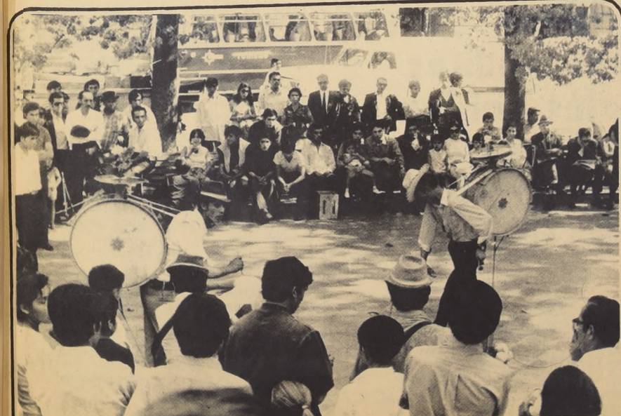
El organillo tradicional con el loro que sacaba la boleta de la suerte también rindió tributo al paso del tiempo que todo lo transforma. Agiles muchachos bailan y ejecutan ritmos modernos de música a go-go o soul, en sus respectivos bombos con platillos, mientras sus acompañantes rasgan las cuerdas de una guitarra y el teclado negro y blanco