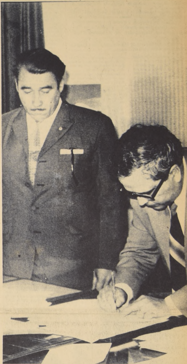
FIRMA DEL CONVENIO. En un acto que presidió el Ministro del Trabajo, José Oyarce, se firmó el convenio entre los trabajadores y la CAP, por el cual se fija un procedimiento interno de negociación colectiva. En el grabado, el Secretario de Estado estampa su firma en el acta respectiva.

Al informar el presidente de la Asamblea, canciller de Colombia, Alfredo Vásquez Carrizosa, la imposibilidad de anular puntos de vistas, los jefes de delegaciones de los seis países mencionados comentaron a pedir la palabra para explicar sus respectivos retirados.