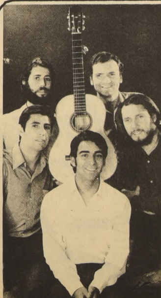
LOS FORTINEROS, el afilado conjunto folklórico defenderá un tema de gran contenido humano: "LA PALOMA Y EL CAZADOR" lo dará a conocer en Viña.

La jornada, inicial comienza a las 19 horas. Allí todo servirá para poner en marcha un festival que tiene que cambiar. Tiene que ser más festival y menos show.