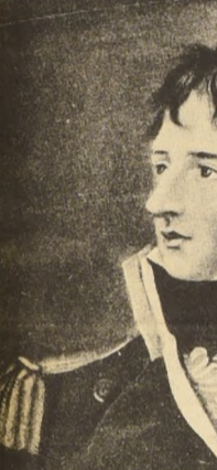
EL ALMIRANTE LORD COCHRANE, quien dirigió la captura al Fuerte de Corral y la caída de la Plaza de Valdivia.

En el viaje al sur la "O'HIGGINS" sufrió serias averías transbordando la tropa a la goleta "MOCTEZUMA", al mando del Teniente Haswell y al bergantín "INTREPIDO", del Comandante Carter, nave con las cuales COCHRANE entró a la bahía simulando ser españoles.