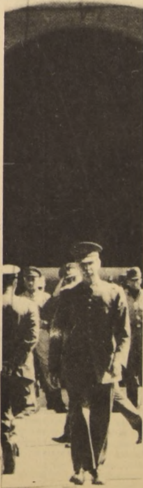
Amnistía para los militares del "tacnazo".

No alcanzará a enjuiciados en el asesinato de Schneider.