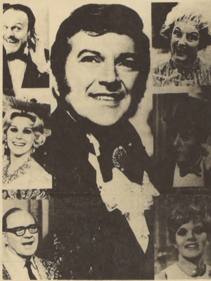
SHOW DE LIBERACE. Todos los jueves a las 21 horas por Canal Nacional se podrá ver toda la versatilidad artística de este músico y sus invitados de gran calidad.