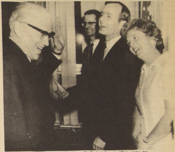
NACIONES UNIDAS.- El Embajador soviético ante las Naciones Unidas, Jakob Malik, saluda amablemente a George Bush, nuevo Embajador norteamericano, que aparece con su esposa.- Al centro, el delegado norteamericano permanente, Christopher Phillips.

Mil 500 policías y 81 vehículos blindados fueron utilizados para la operación contra la Universidad, mientras altos jefes militares presenciaban el operativo desde un helicóptero que sobrevolaba los alrededores.