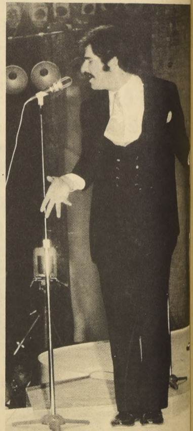
Ayer a las 21 horas en la Medialuna de Peñafiel, dicha Compañía dio un homenaje al humorista revelación del Festival de Viña del Mar.

Finalmente, en Lota hicieron una presentación de cine y tuvieron un encuentro con los artistas de la Casa de la Cultura.