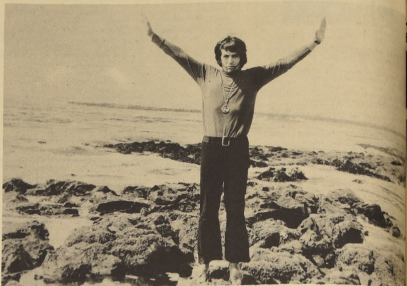
Jhuliano: un nuevo ritmo.

El Alcalde Lagne, por su parte, agradeció el gesto, señalando su complacencia por el propósito de estrechar más aún las relaciones amistosas entre la República Árabe Unida y Chile.