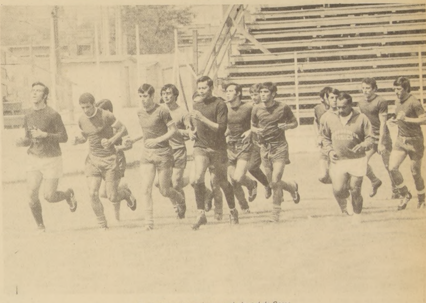
Optimismo contagioso en el plantel de Cerro.