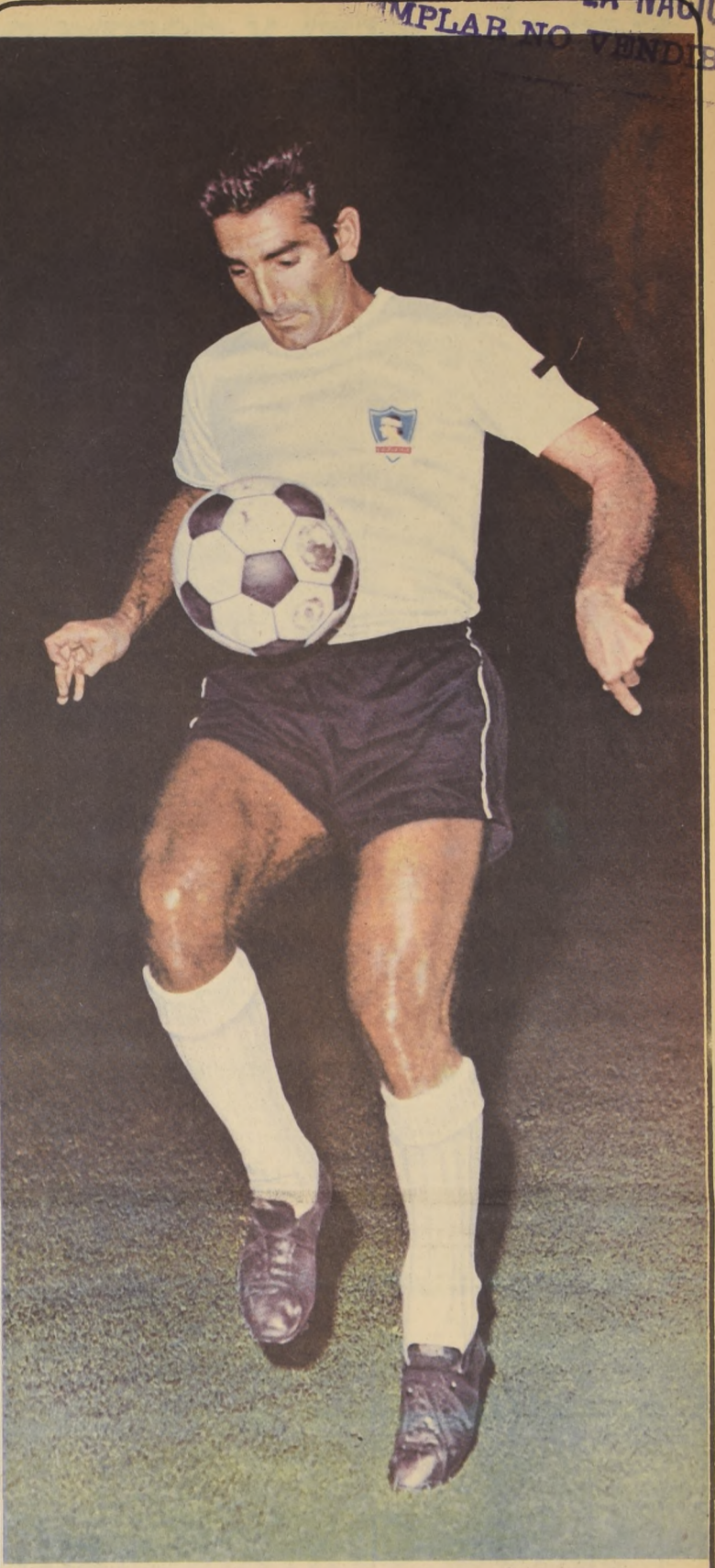
Reaparece como puntero izquierdo:

La promesa de los tres jefes castrenses fue similar a la hecha el 18 de junio de 1970, cuando designaron al General Levingston como Presidente, de la República, 10 días después de haber separado del mismo cargo a otro general retirado, Juan Carlos Onganía.