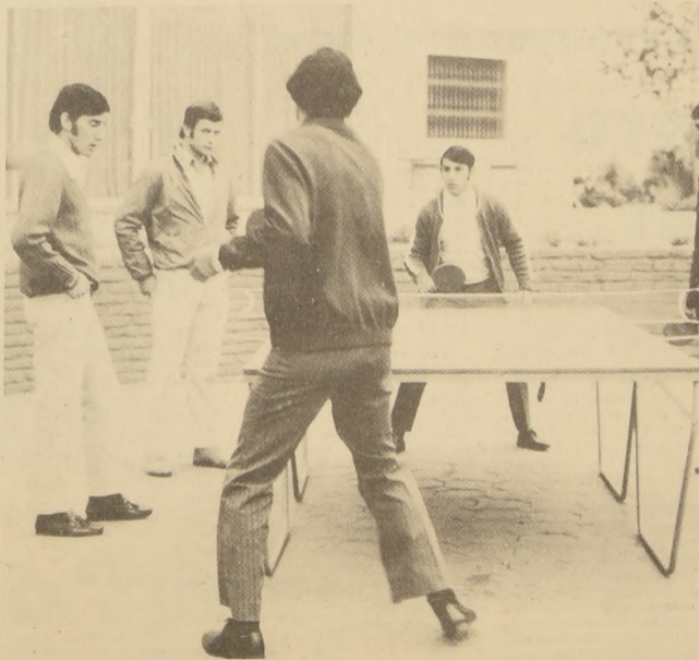
Recreación con partidos de pimpón. Siempre una pelotita por delante.