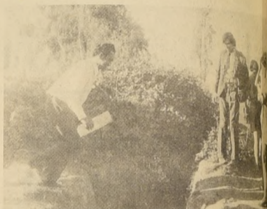
"NO SE CAIGA, PUES MINISTRO"... Hubo que enterrarse, saltar acequias y hacerle el quite a los perros. Pero así el Gobierno Popular se entera de los problemas de los pobladores.