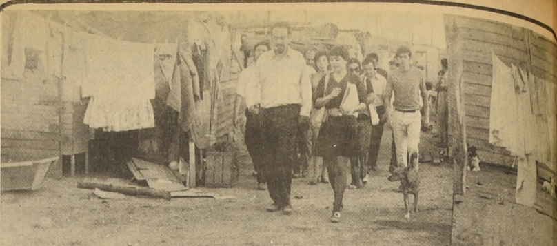
SIN CHAQUETA y optimista, el Ministro Suárez le dio un vistazo a los campamentos de la comuna de Las Barrancas, en donde el lunes se inició la "Operación Invierno".

El secretario de la Junta Provincial de Auxilio Escolar y Becas, dijo que la entrega de zapatos a los escolares con mayores necesidades se hará de lleno en Valparaíso durante el mes de Abril. De los 500 mil pares que se entregaron a nivel nacional una cuota importante corresponderá a Valparaíso, de cuya distribución se hará cargo el Sindicato Único de los Trabajadores de la Enseñanza.