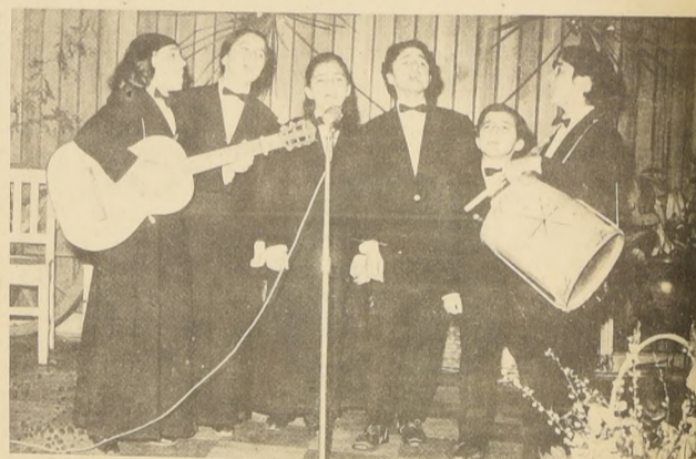
El Teatro Popular representa a un grupo de artistas provincianos que desean triunfar en T. V.

Gran afluencia de público tuvo este fin de semana el Estadio Chile. ¿La razón?, se presentaba el espectáculo integrado del TREN POPULAR DE LA CULTURA que hace unos días llegó de su recorrido por el sur, haciendo escala en cada cabecera de provincia.