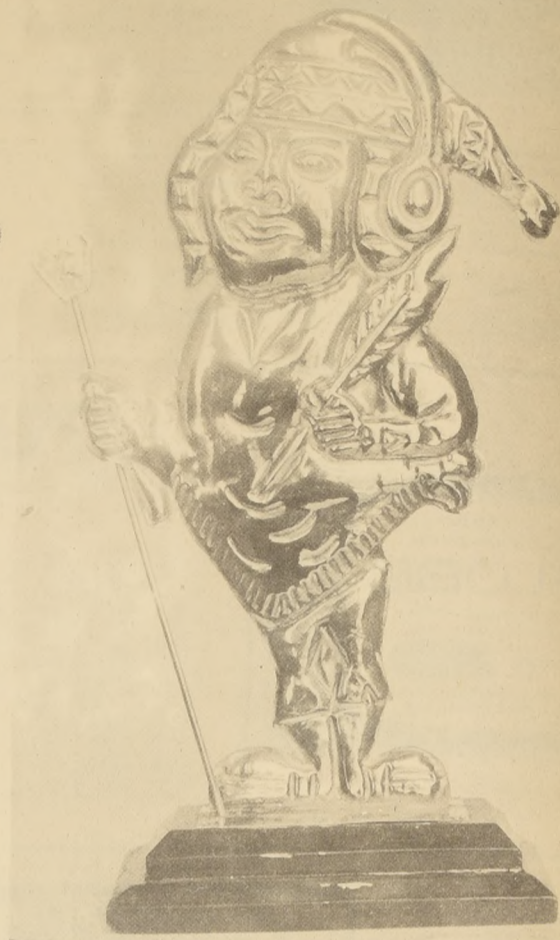
ESTE ES EL GALARDON "AMAUTA DE ORO", que entregan el "Círculo de Cronistas de Espectáculos" y la "Cadena de Comentaristas de Discos de Perú" a los colegas chilenos.

Este juvenil conjunto ha obtenido singulares triunfos en las ciudades de Osorno, Valdivia, Los Angeles, Concepción, Linares, Talca, Santiago, Antofagasta e Iquique, aparte de una serie de capitales de departamentos y comunas donde han llevado lo mejor de su repertorio y han logrado triunfar en representación de nuestra ciudad.