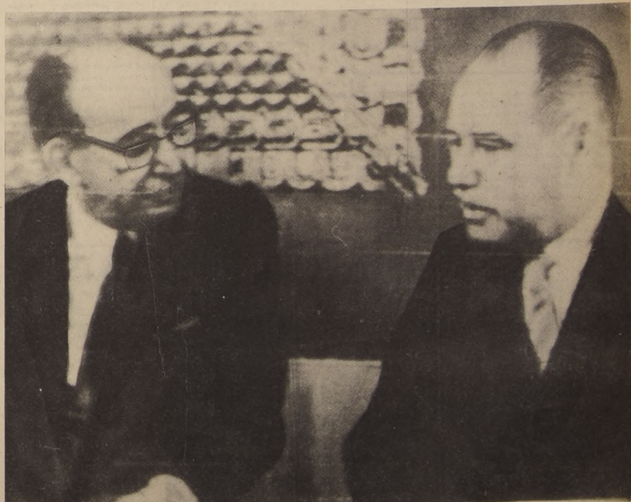
El Canciller cubano Raúl Roa realizó una breve escala en el aeropuerto "Jorge Chávez", donde fue recibido por su colega peruano, Edgardo Jarring. Posteriormente el Canciller cubano partió de regreso a La Habana.