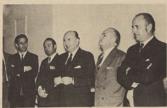
IMPULSO AL AHORRO. Un vigoroso impulso al sistema de Ahorro Sistemático se ha resuelto dentro de las normas de la Caja Central de Ahorros y Préstamos, debido a que en él pueden participar personas o grupos familiares de todo nivel de ingreso.

El MOVIMIENTO estudiantil chileno en conocimiento del fallo de los sucesos acontecidos en la vecina República de Bolivia, acción que ha sido dirigida por el imperialismo norteamericano y las fuerzas fascistas de América Latina señalan lo siguiente: