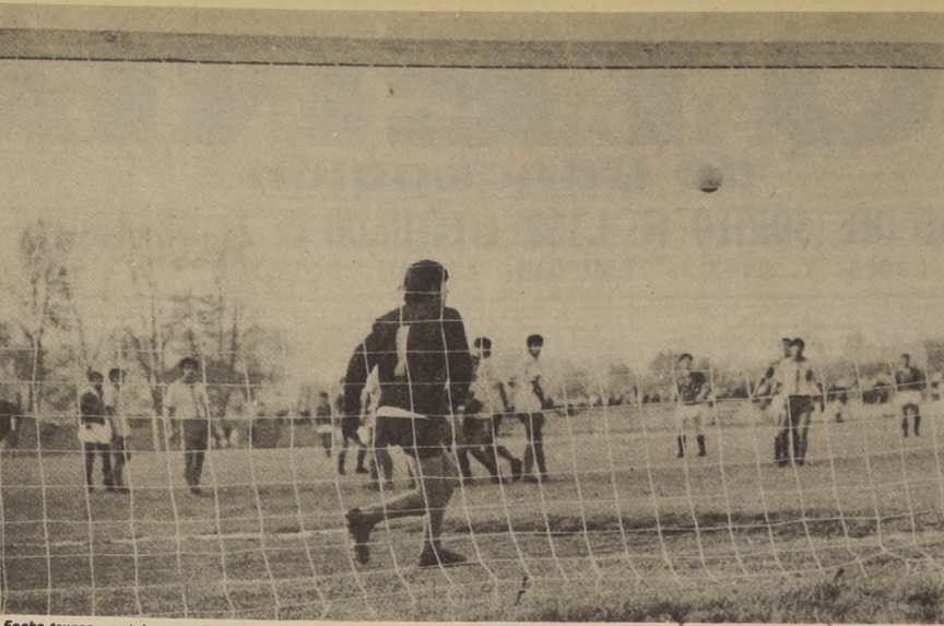
Fecha trunca en el Ascenso. El mal tiempo obligó a suspender los encuentros. Cinco punteros encabezan la tabla de posiciones al término de la octava fecha.

Podemos hablar mucho sobre la Gimnasia Deportiva femenina... (pero sólo nos limitaremos a transmitir algunas opiniones sobre esta casi desconocida especialidad.)