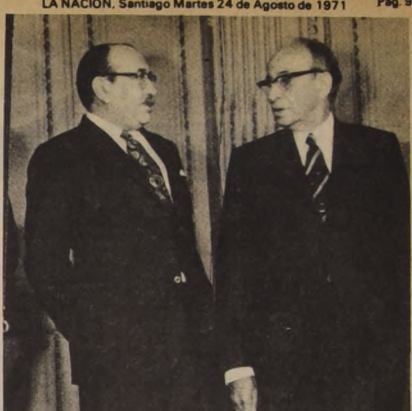
LOS CANCELIERES DE CHILE Y CUBA, Clodomiro Almeyda y Raúl Roa, respectivamente, que emitieron una declaración conjunta luego de la visita a nuestro país del Ministro cubano.

cooperación, internacional y lesiona las relaciones económicas y políticas de los estados que procuran el rescate de sus recursos naturales. constituyen una violación de los derechos fundamentales de los pueblos.