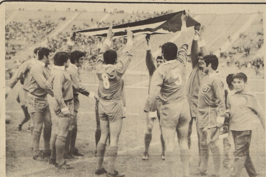
Los jugadores de Universidad de Chile salieron al campo del Nacional portando una bandera de Cuba. Gran amistad existe entre los jugadores chilenos y caribeños, la que quedó demostrada en la comida que la "U" ofreció a la visita el domingo en la noche.