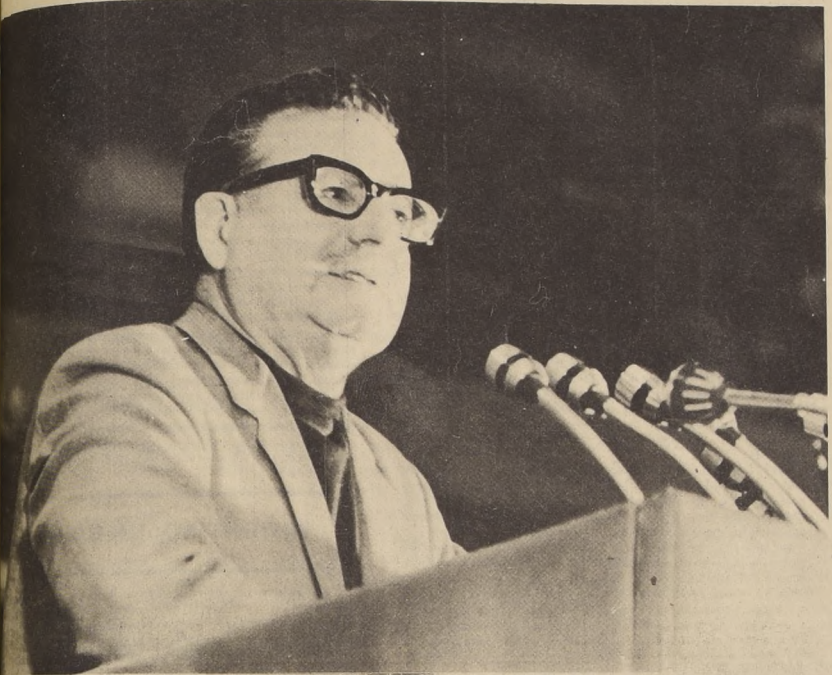
Compañero Presidente, doctor Salvador Allende