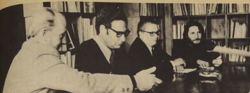
Durante la firma del convenio entre el Ministerio de Agricultura y el Instituto Interamericano de Ciencias Agrícolas (IICA)...