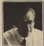
POR MIGUEL MERELLO M.