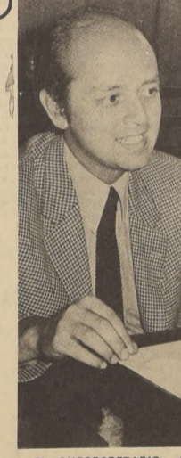
EL SUBSECRETARIO DE Justicia, José Antonio Viera Gallo, quien ha participado en la discusión del proyecto.

extraordinarias, eligiéndose simultáneamente reemplazantes de los titulares. Se propone también que las elecciones de los miembros de la Cámara Unica se realicen conjuntamente con las del Presidente de la República y facultar al Jefe del Estado para disolver la Cámara Unica por una vez durante su período. Según se indica en la iniciativa, una de las ventajas de este sistema unicameral es la adecuación a la realidad socio-política chilena, ya que el actual sistema bicameral puede justificarse en estados donde existen diferencias de intereses que buscan estar representados en distintos órganos del parlamento.