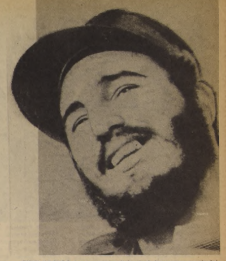
FIDEL CASTRO. Las juventudes de izquierda le preparan un triunfal recibimiento.

que inintuitamente pretende desprestigiar al líder cubano. Concientes están que la presencia de Fidel desnudará sus mentiras y esclarecerá cómo el pueblo de Cuba supo liberarse de la explotación imperialista, fortaleciendo con ello nuestra propia lucha. Demás está decir que todo intento fascista será barrido por la juventud y el pueblo chileno. El Comando Juvenil de la Unidad Popular y la Izquierda Cristiana formula un combativo llamado a todos los jóvenes de nuestra patria a expresar alegremente nuestra solidaridad revolucionaria con el pueblo de Cuba, representado en Fidel Castro, otorgándole la gigantesca y cordial bienvenida que se haya dado en Chile a persona alguna.