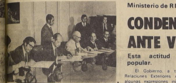
El grabado muestra los instantes en que autoridades del Ministerio de Minería, CORFO y ENAP suscriben el documento por el cual GASVALPO se integra al área social.