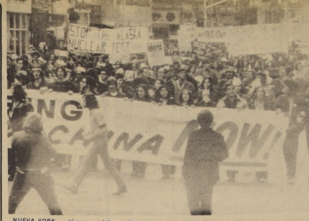
NUEVA YORK.— Jóvenes y adultos realizan una manifestación por la Sexta Avenida en dirección a Central Park. Los manifestantes, unos cinco mil, protestaban por la presencia norteamericana en Indochina y contra la explosión nuclear de Amchitka.

BELFAST, 8 (ANSA).— Explosiones y bombas de clavos lanzadas contra soldados ingleses, caracterizaron la mañana de hoy en el Ulster, después de una noche definida insólitamente tranquila por un vocero del Ejército.