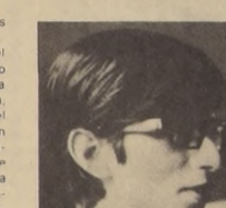
LUIS BADILLA. La I.C. saluda también la llegada de Fidel.

Entre los pueblos explotados que luchan por su liberación. La visita del Compañero Fidel Castro concita nuestro apoyo combativo y nuestra calurosa bienvenida. Esta visita importa no tan sólo porque se trata del representante máximo de un pueblo soberano y de una revolución triunfante, sino porque se trata además de la presencia de una experiencia trascendental en la convergencia de cristianos y marxistas en Latinoamérica.