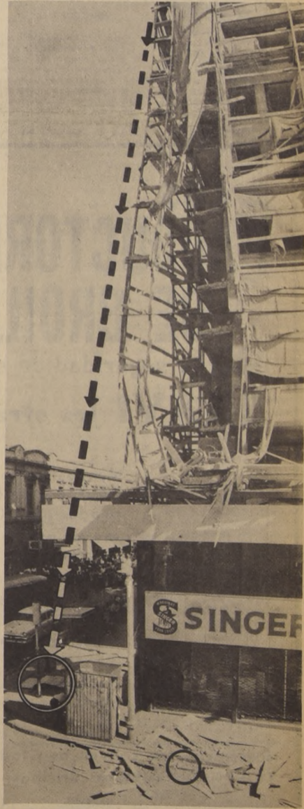
A las cuatro y media de la tarde de ayer, los transeúntes que caminaban por las calles Rosas y Puente, creyeron que en Santiago estaba temblando.

Por su parte voceros federalistas atribuyeron su éxito a un creciente desdén, tanto en los belgas de habla francesa como en los de habla flamenca de tener más peso en las opiniones sobre sus propias cuestiones.