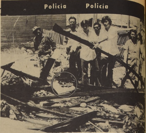
LOS VECINOS DEL CAMPAMENTO "VENCEREMOS" señalan el sitio en que fueron encontrados los restos de los tres desafortunados hermanos.