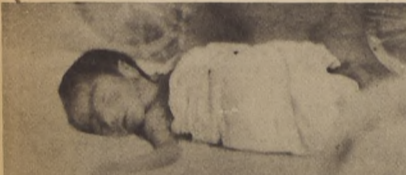
LOS TRILLIZOS, todos varones, pesaron 1 kg. 120 gr., 1 kg. 300 gr. y 1 kg. 450 gr. Según la matrona que los atiende, su estado es regular y uno de ellos ha presentado dificultades respiratorias.