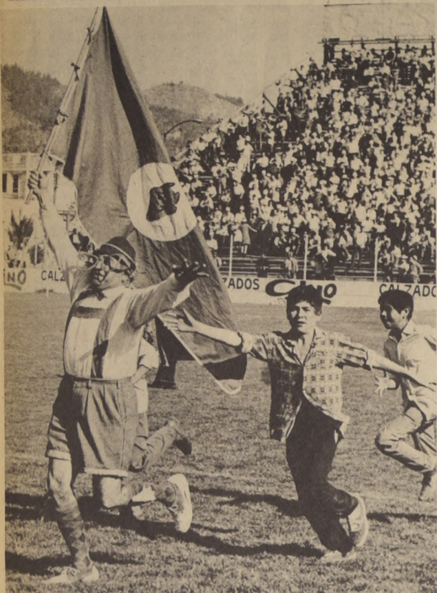
EL "DOCIOR CERDA" así se le llama en Chillán. Es un poco un disfraz, pero también un símbolo de lo que trajo la enti-