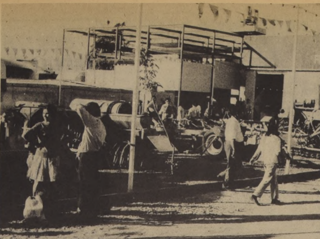
VISIA PARCIAL de la exposición de maquinarias de la RDA. Un milagro en espacio de 780 metros cuadrados.