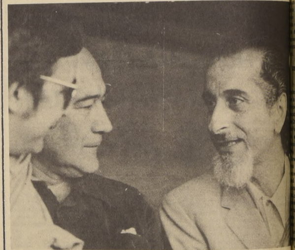
EL MINISTRO DEL INTERIOR, José Iloá estuvo el Sábado en la tarde en el Estadio Santa Laura presenciando el match entre Nublense y Palestino. El Ministro además de sus preferencias por la "U", también es hinchado de Nublense, el club de la ciudad donde nació.