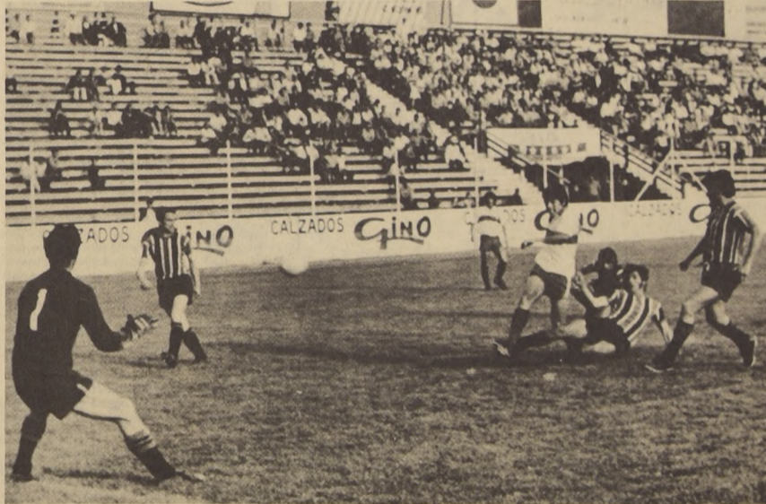
Universidad Católica apareció muy distante de los primeros lugares. Huachipato en cambio, luego de su empate, queda en una ubicación muy "comprometedora".

Restando seis fechas por jugar, Magallanes, Green Cross y Audax deberán extremar sus esfuerzos para zafarse el último lugar de la tabla.