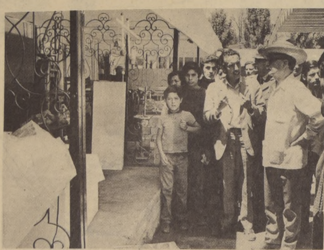
Un largo diálogo con los trabajadores el Presidente Allende, durante su sorpresiva visita a la FISA.

Agrega el comunicado que el anuncio se recibió desde la zona