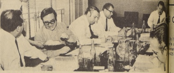
En pleno proceso de análisis de los antecedentes de los candidatos a Premios Nacionales de Periodismo, los miembros del Jurado, integrado por los Presidentes del Colegio Nacional de Periodismo, los Presidentes de los Colegios Regionales, los Diputados del Senado y de la Cámara de Diputados y el Rector de la Universidad de Chile.